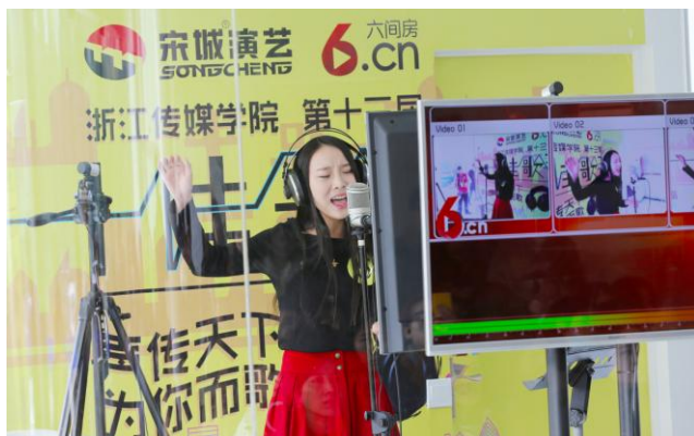
宋城演艺六间房透明直播间在高校首次亮相

在“拥抱互联网”的战略下，3月18日，公司公告以26亿元并购目前中国最大的社交视频网站——北京六间房科技有限公司，并在2015年8月完成交易实现并表。此次并购是公司在国内产业结构调整、经济结构转型和制度环境变化的大背景下制定的重要战略转型举措，是围绕“构建以演艺为核心的繁荣生态圈”为目标所迈出的跨越式的一步，标志着公司完成了从线下往线上的布局，正式涉足互联网娱乐板块。