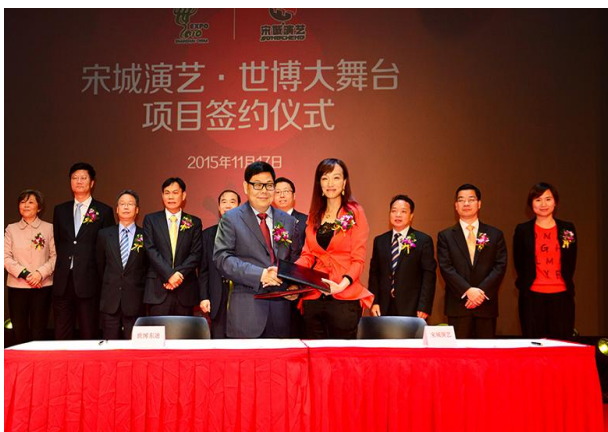
2015年11月17日，宋城演艺签约上海

报告期内，公司通过强强联合的方式在桂林和上海实现新项目的落地，为公司未来的发展打造新的业绩增长点，同时在合作开发模式和城市演艺领域实现新突破。其中，与桂林旅游合作共建《漓江千古情》，是公司首次与行业上市公司强强联合，有望实现资源共享、优势互补。与上海世博合作，将推出《上海千古情》等全新演艺作品，进一步拓展城市人群、开发城市演艺市场，并在艺术创作、演艺形态等方面争取形成重要突破。在公司第一批异地复制项目取得巨大成功的基础上，依托公司强大的品牌和复制能力，上海、漓江项目未来必将延续爆发式的增长。