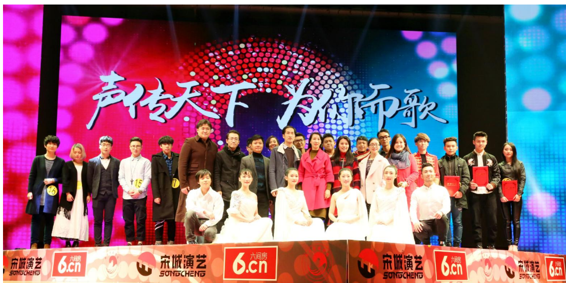
宋城演艺鼎力支持浙江传媒学院“十佳歌手”总决赛，六间房全程直播

报告期内，六间房实现收入72,715.28万元，净利润16,207.24万元，超额完成业绩目标。