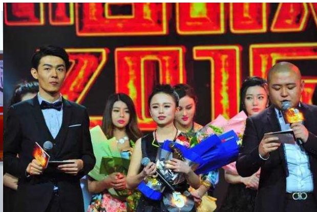
六间房2015年度“唱战”决赛火爆收官19岁大二女生夺冠

2015年，六间房月均页面浏览量达5.34亿，注册用户数达3,518万，网页端月均访问用户达到2,857万，较2014月均增长约45%，移动端月均访问量较2014年增长79.9%，年均月人均充值金额为702元。