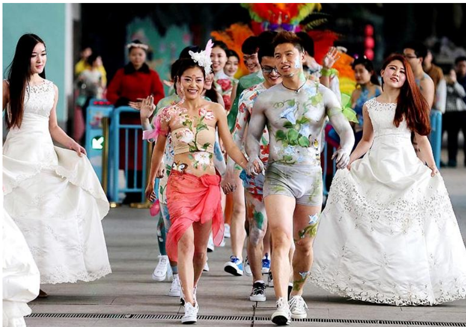
杭州乐园“裸婚”活动成为全球线上级新闻话题，点击量破亿

报告期内，公司以创意为杠杆，以新媒体为抓手，以事件营销为手段，对各大旅游区进行整合策划、整合宣传，全年策划推出了新春大庙会、花痴节、肚兜节、面具节四大主题活动；“羊年工资就不交”、“全球首创过山车裸婚典礼”等30余个专题活动；并转变宣传推广方式，从传统的电视、广播、报纸的硬广投入，改为更有爆炸力和传播性的事件营销的新媒体传播方式，充分利用创意的杠杆撬动传播，多个活动登上百度、新浪、腾讯、搜狐等头条，点击量频频破亿，成为全国、甚至全球的现象级话题，引发美国、韩国等多家国外媒体纷纷报道，不仅有效控制了广告投入，也极大提高了公司产品的网络曝光率。