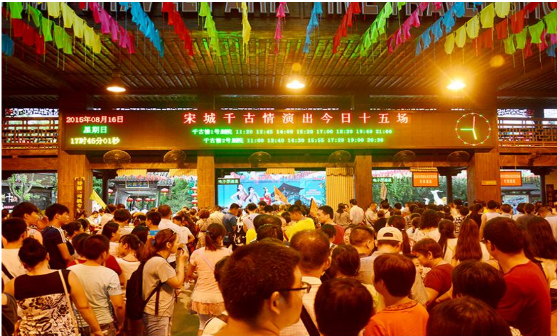
2015年8月16日，《宋城千古情》单日15场创记录

报告期内，公司整体观演人数2,233.83万人次，大幅增长53.42%。其中：宋城千古情观演人数增幅创近5年新高，8月16日更是创造了单日演出15场的奇迹；三亚千古情观演人数同比增长87.56%，连续第二年保持高速增长；丽江千古情观演人数同比增长181.82%，成为增长最快的项目；九寨千古情观演人数同比增长近60%，成为当地最具竞争力的演艺企业。