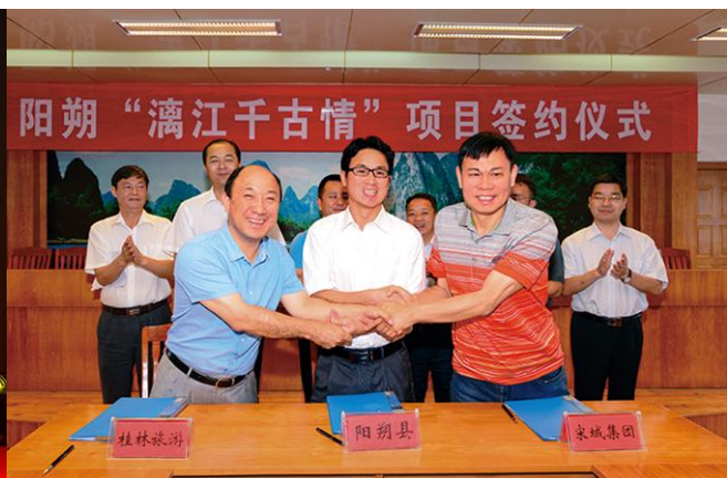
2015年9月15日，宋城演艺签约桂林