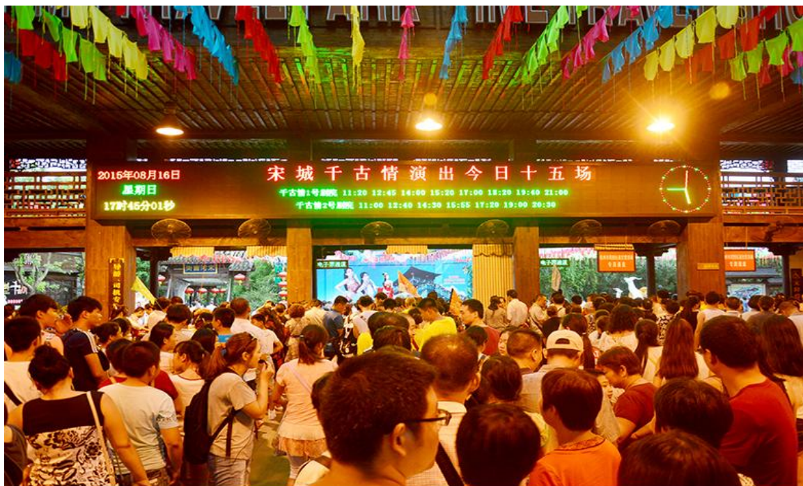
2015 年 8 月 16 日,《宋城千古情》单日 15 场创记录

报告期内,公司整体观演人数 2,233.83 万人次,大幅增长 53.42%。其中:宋城千古情观演人数增幅创近 5 年新高,8 月 16 日更是创造了单日演出 15 场的奇迹;三亚千古情观演人数同比增长 87.56%,连续第二年保持高速增长;丽江千古情观演人数同比增长 181.82%,成为增长最快的项目;九寨千古情观演人数同比增长近 60%,成为当地最具竞争力的演艺企业。