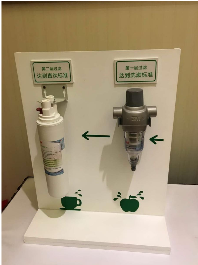
在项目中应用的 3M 净水系统展示