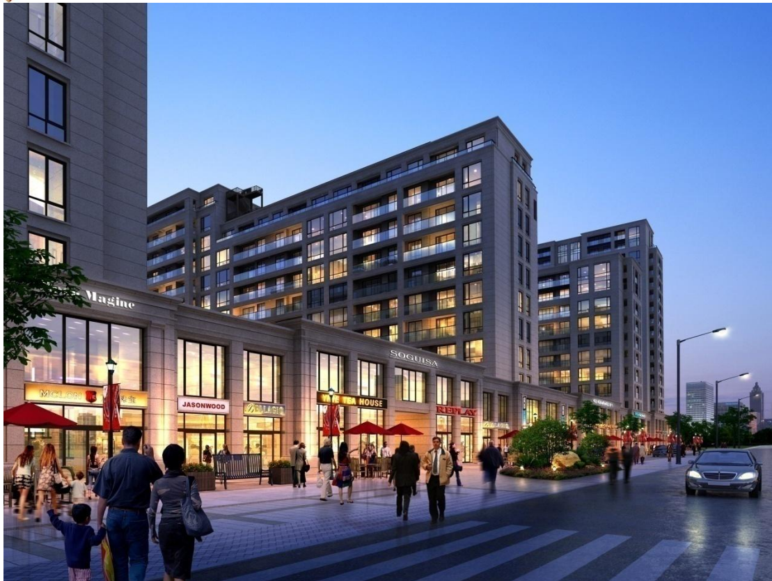
荣安风情街效果图