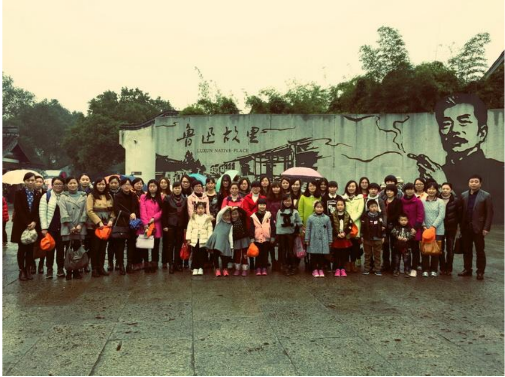
2015 年 3 月，公司组织女员工来到绍兴参加“三八”节旅游活动。