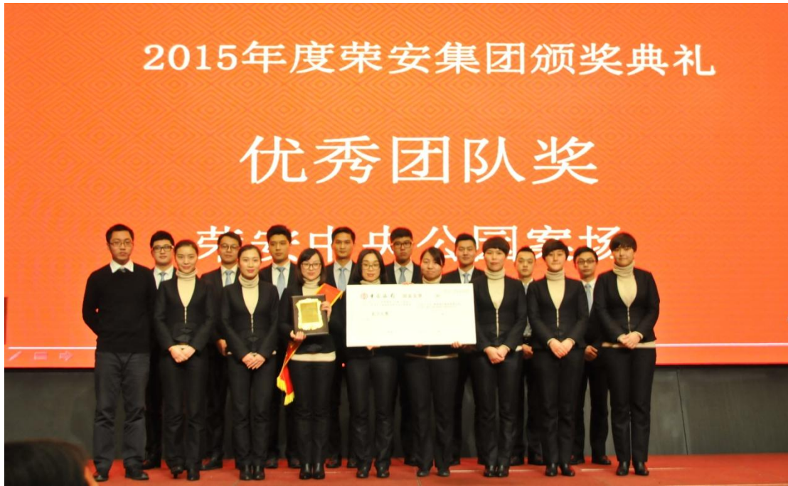
2015 年度颁奖典礼现场