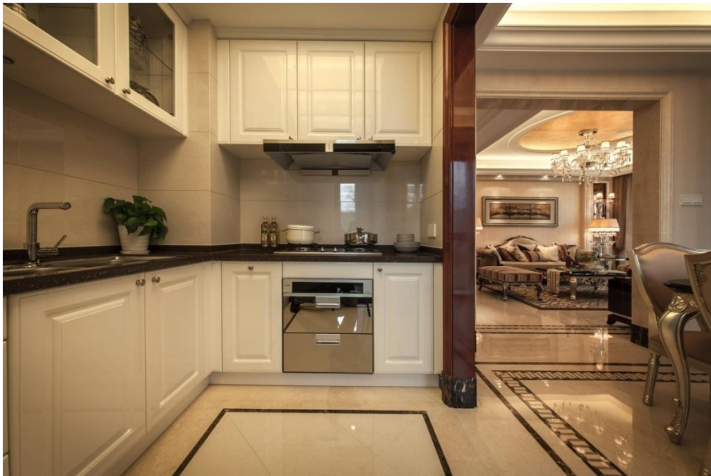
荣安香园精装修样板房实景图

多年的精装修项目使得公司在设计、选材、施工、现场管理等各方面都积累了丰富的经验，在荣安府项目的基础上，2015 年公司开发的荣安香园、代建项目荣安中央公园都采用或部分采用了精装修工程。我们的精装修产品，不仅外表高贵、典雅，而且在收纳空间等人性化方面做足了功课，在体现产品的价值感之余，还让客户感觉到了我们追求完美的责任与情怀。