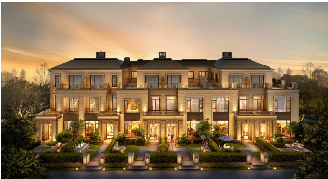
经济型别墅——荣安香园效果图

“让城市提升品位”，荣安地产始终以此为使命，不断学习，不断超越自己，根据市场需求设计套型，比如二胎家庭需求、老年住房需求、经济型别墅需求等等，为更多的消费者提供住宅产品。