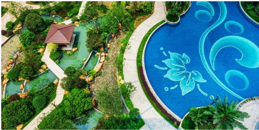
台州金域华府项目实景俯瞰图

把景观绿化做到极致，是荣安开发住宅项目的一大特色。2015 年开发的“荣安月园”、“荣安香园”、“荣安凤凰城”，光看小区的名字就能让人浮想联翩，眼前呈现鸟语花香的园林。荣安的景观有三个层次，第一，是有视觉效果的景观，有美感，绿化率高；第二，是有文化的景观，具备精神内涵；第三，是生态型景观，保证低碳和宜居，让小区拥有完整的生物链，鸟语花香，负氧离子高。