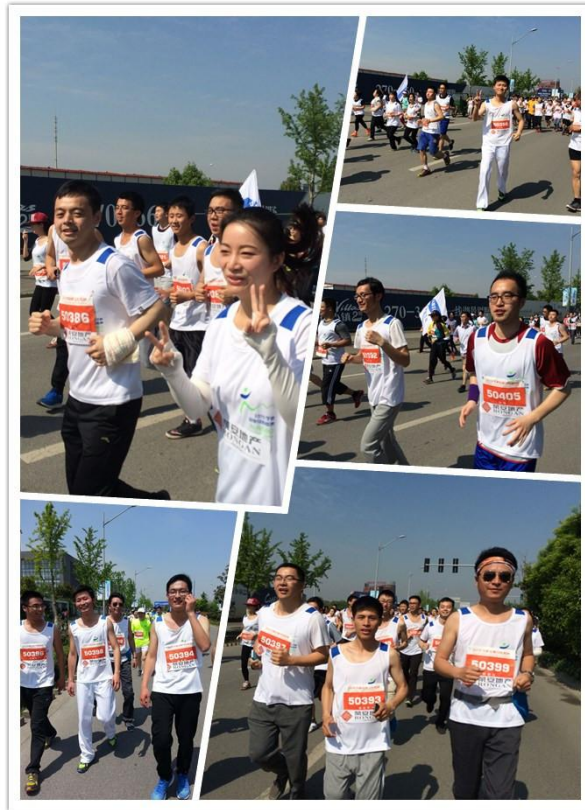
2015 年 4 月，公司长跑俱乐部参加 2015 年宁波第二届山地马拉松比赛。