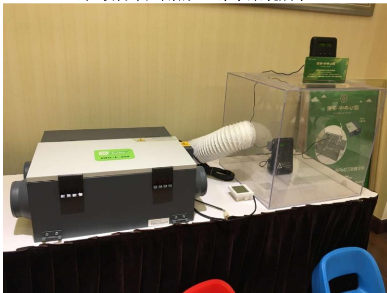
在项目中应用的恩科新风、空气净化系统展示