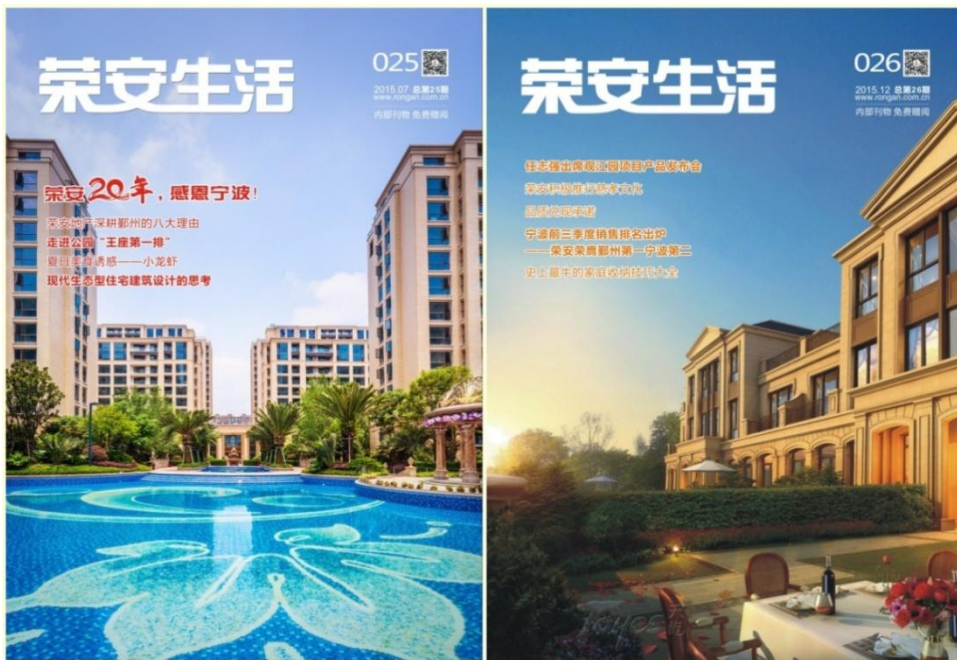
新改版的公司内刊《荣安生活》

经过 6 年多时间的积累，公司内刊已经走向正轨，通过公司内部新闻采集、新人新事报道等，在员工中宣传公司文化与企业价值观，树立标杆，增强竞争意识。弘扬优秀的企业文化和企业理念，用优秀的文化感染人，增强企业凝聚力。为了体现“给您一个更温馨的家”的使命感，2015 年公司在原有内刊《荣安地产》的基础上，改版为《荣安生活》，更加关注城市生活，贴近生活，更具可读性。