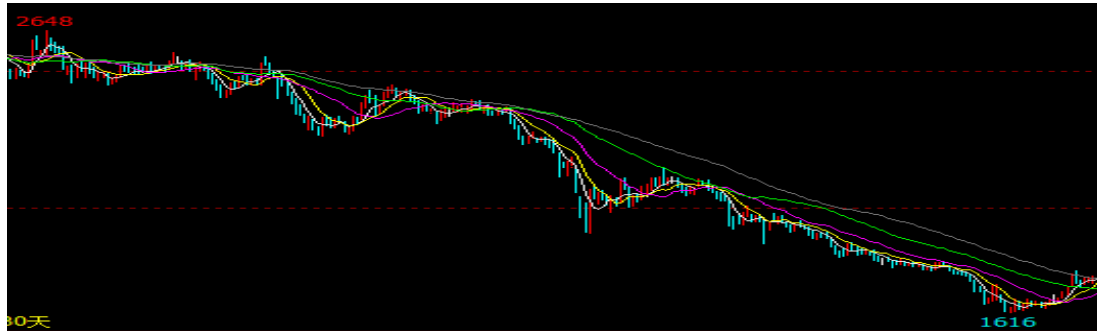
图2：2015年钢材价格走势