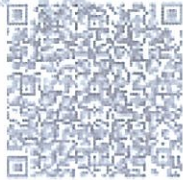
在线查询企业详细信息