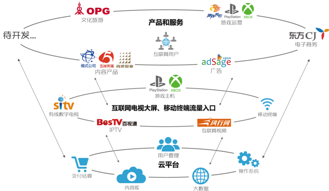
图 东方明珠互联网媒体生态系统

多种传播渠道，已成为中国最大的多渠道视频集成与分发平台；旗下数字营销、主机游戏、电视购物、文化娱乐旅游等传媒相关服务行业领先。公司正以强大的媒体业务为根基，以互联网电视业务为切入点，建设覆盖线上线下的泛娱乐产业平台，推进受众向用户的转变以及流量变现，加快构筑互联网媒体生态系统、商业模式与体制架构，打造中国最具市场价值和传播力、公信力、影响力的生态型互联网媒体集团。