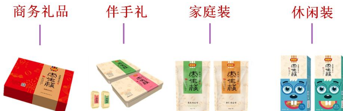
图 2 产品开发的四个层次

公司 2016 年度规划产品升级及新品开发共计 262 个单品。报告期内，纵向方面已开发 92 款产品，横向方面已开发 25 款产品。目前，公司已全面上市“好七粥”、“我的早餐”及“我的坚果”等明星产品，以“定量”、“定时”的概念，将健康食材与红枣、坚果巧妙融合，把“标准、健康、食养生活方式”的理念植入消费者日常生活中，满足消费者健康养生的饮食需求。同时，公司根据 2016 年产品发展规划，不断优化产品结构、调整现有产品格局，改进产品品质、包装规格及定价等相关要素，进一步增强产品的竞争优势。