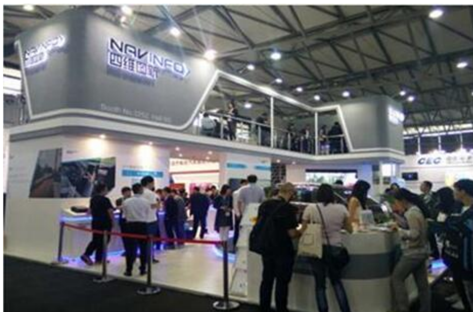
四维图新参加2016第二届亚洲国际消费电子展(CES ASIA)展会