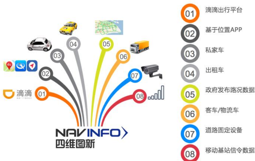
四维图新海量交通出行大数据

本报告期内，在动态交通信息服务方面，加快融合包括互联网数据、车辆物流数据、移动终端数据、通讯信令数据等在内的多源数据，并基于丰富海量交通出行大数据及大数据生态系统，加大产品和技术创新研发，将语音/语义生物识别技术引入数据采集及应用当中，提高信息深度、广度和鲜度，提升产品质量和覆盖率的同时，提升运营效率；与高等院校合作研发基于机器学习的路况预测系统 Pattern 系统。