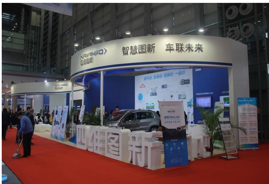
四维图新首次亮相深圳国际汽车改装服务业展览会（AAITF）

本报告期内，公司继续加强公司品牌及产品品牌建设及推广力度，在扩展和深挖传统宣传渠道的基础上，积极探索自媒体等新兴传播方式，通过多种形式的市场活动，进一步提升“四维图新”品牌的品牌形象及行业影响力，并深入推进“四维图新”迈向“基于位置信息大数据+算法+计算能力的平台服务提供商”形象的品牌角色转变。2016年2月，公司首次参加在深圳举行的第12届深圳国际汽车改装服务业展览会（AAITF），集中展示布局汽车后市场以来的新产品；5月，公司参加2016第二届亚洲国际消费电子展（CES ASIA）展会，推出多个新产品及服务；6月，公司作为战略合作伙伴全程参与全球地理信息开发者大会。