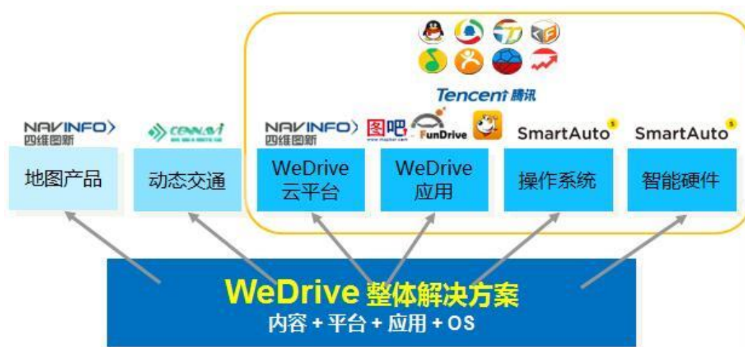
四维图新车联网整体解决方案

语音/语义识别方案等车联网各项产品的开发及商用进度，与车厂、Tier-1 等客户共同探索核心业务变现及商业模式创新；截止 2016 年 6 月底，长城车厂 H6 系列全面 SOP，后装产品落地稳步推进。面向下一代自动驾驶场景，公司进一步完善产业布局，加强产业资源整合及联合开发力度，并与云端海量数据处理及服务平台形成良性互动，全面提升面向车载领域提供最完整的、拥有完全自主知识产权的车联网整体解决方案的能力。商用车联网服务方面，公司时刻关注产业发展动态和趋势，及时调整并完善面向新型市场的产品体系，加大面向物流、卡车、驾培等具有行业特色的细分市场的市场开拓力度，建立并逐步扩大销售渠道，提升用户规模。