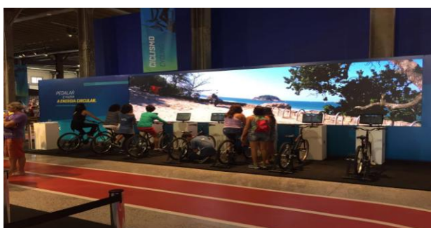
2016巴西奥运会奥运村 UTV2.5

在2016巴西奥运会期间，洲明Upad III 与UTV系列产品被分别应用于Cidade Das Artes艺术馆、奥运村及Visa馆。此外，报告期内新增实施完成的主要项目有：上海GE数字创新坊项目（三块UHP1.2标准分辨率小间距LED内弧屏与一块P5装饰屏）；携手中国普天亮相2016年中国国际信息通信展览会，呈现了中国普天公安扁平化指挥调度平台、智慧健康养老平台以及南方电视频会议、远程医疗等领域的应用解决方案；2016年“鲁能·潍坊杯”国际青年足球邀请赛P10球场屏项目等。