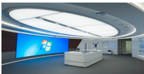
上海GE数字创新坊UHP1.2内弧屏