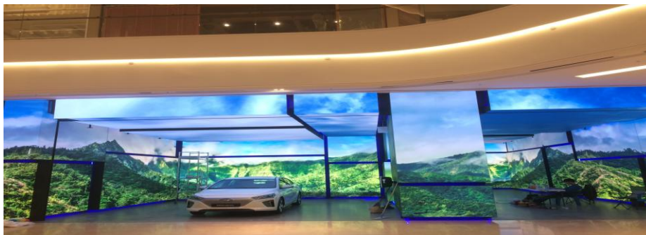
韩国新世界百货汽车旗舰店 Uslim2.6

在第四季度，公司将贯彻围绕“产业+互联网+金融”一体两翼的发展战略，聚焦经营目标达成，通过“技术+内容+服务”持续提升全球市场份额，在积极把握PPP（Public—Private—Partnership，公私合作模式）模式下新发展机遇的同时，继续探索并实施事业合伙人制度，以实现企业整体更大步伐、专注地向前迈进。