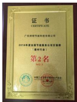
2016年度全国节能服务百强榜