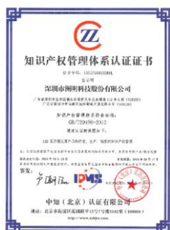
知识产权管理体系认证证书

公司自成立以来，坚持以研发创新为导向，始终重视知识产权管理保障工作，以知识产权保障科技创新，以创新实现赶超，引领未来。为进一步深化实施知识产权管理体系，公司引入《企业知识产权管理规范》（GB/T29490-2013）并始终贯穿在公司的研发、生产、销售等各个经营管理环节，以高效的标准化管理模式规范公司的知识产权管理，进一步提升公司知识产权创造、运用、保护和管理的的能力。报告期内，公司洲明科技顺利通过知识产权管理体系现场认证审核，成为行业内率先通过知识产权管理体系认证的企业之一，这对于提升公司的创新能动力和市场竞争力、提高抗风险能力、保障公司的可持续发展均具有重要意义。