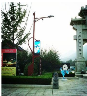
少林寺 LED 智慧路灯

为了顺应智慧城市、万物互联的时代浪潮，“智慧路灯”作为“智能城市”的先行军，公司积极探索智慧路灯的发展方向和可行的商业模式，9月下旬，公司LED智慧路灯凭借智能、集成、节能、美观等优点和自主研发、工程服务的核心竞争力，选择少林寺作为智慧路灯普及的第一站。