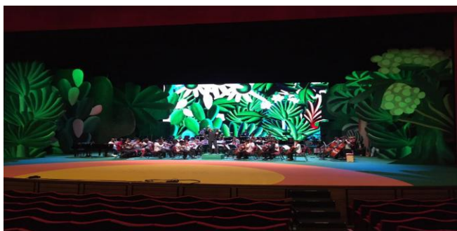
里约Cidade Das Artes艺术馆 UpadIII5.9

公司持续优化改善供应链体系，在第三季度，公司业务订单继续保持快速增长，出货量较第一、二季度取得明显提升。