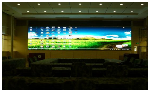
南京解放军理工学院小间距产品

公司自成立以来，坚持以研发创新为导向，始终重视知识产权管理保障工作，以知识产权保障科技创新，以创新实现赶超，引领未来。为进一步深化实施知识产权管理体系，公司引入《企业知识产权管理规范》（GB/T29490-2013）并始终贯穿在公司的研发、生产、销售等各个经营管理环节，以高效的标准化管理模式规范公司的知识产权管理，进一步提升公司知识产权创造、运用、保护和管理的的能力。报告期内，公司洲明科技顺利通过知识产权管理体系现场认证审核，成为行业内率先通过知识产权管理体系认证的企业之一，这对于提升公司的创新能动力和市场竞争力、提高抗风险能力、保障公司的可持续发展均具有重要意义。