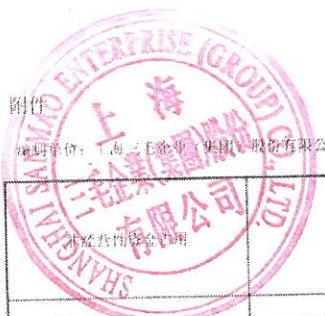
上海三毛企业（集团）股份有限公司2016年度非经营性资金占用及其他关联资金往来情况汇总表