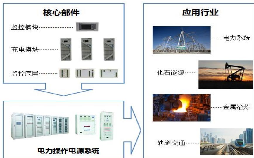
图3 电力操作电源产品核心部件及应用行业

电力操作电源系统是指为发电厂、变电站的电力自动化系统、高压断路器分合闸、继电保护装置、自动装置、信号装置、通信系统、遥控执行系统及事故照明等设备提供交流电源、直流电源、交流不间断电源的电力自动化电源设备，其可靠性、安全性直接影响到电力系统供电的可靠性和安全性。电力操作电源模块是电力操作电源系统的核心部件，主要包括充电模块、监控模块、通信模块、逆变模块等。