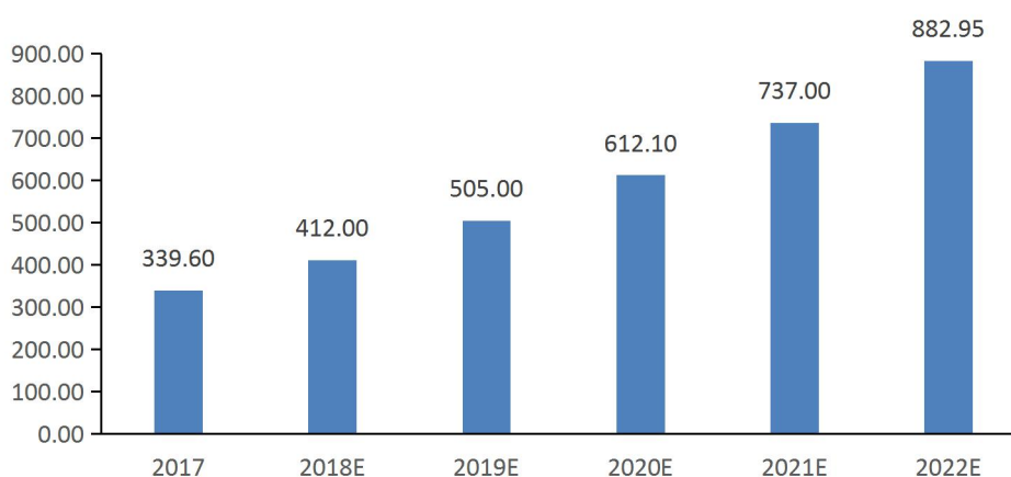
■ 中国银行业IT解决方案市场规模（亿元）

近年来，在利率市场化和互联网金融的冲击下，银行对自身精细化管理、风险控制能力和服务水平等提出了更高的要求，满足客户日益增加的个性化和差异化需求成为银行业未来发展的方向。在此背景下，我国银行业加大了对信息化的投资以保持服务效率，银行业 IT 市场继续保持稳定增长态势。根据国际数据公司（IDC）数据统计，2017 年中国银行业 IT 解决方案市场整体规模达 339.60 亿元，比 2016 年 277.20 亿元增长 22.51%，预测到 2022 年市场规模将达到 882.95 亿元，年均复合增长率为 21.06%。