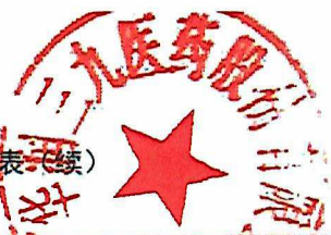
附表1：华润三九医药股份有限公司2018年度非经营性资金占用及其他关联资金往来情况汇总表(续)