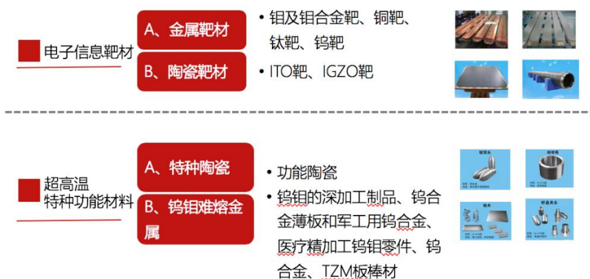
图1 靶材及超高温特种功能材料业务布局

公司参股投资的天华智核公司从事的莫来石颗粒捕集系统载体材料项目，主要应用于汽车尾气处理过滤系统的核心载体材料，该项目是美国陶氏化学公司历时十年，研发的基于莫来石的新型颗粒物捕集器载体技术，并建立了完整的技术研发体系及量产生产线，产品主要技术性能指标已达到国际先进水平，后经公司将其全套产线和完整的知识产权引入中国。下一步随着我国环保政策和相关标准的不断完善，对排放标准的持续提升，内燃机尾气颗粒捕集系统载体材料将面临十分广阔的市场需求。