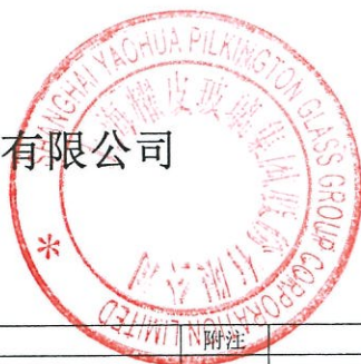
2018年度合并现金流量表 (金额单位为人民币元)