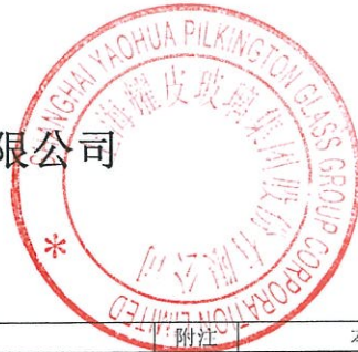
2018年度公司现金流量表 (金额单位为人民币元)