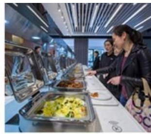
餐盘关联称重餐台，自助取餐自动扣费