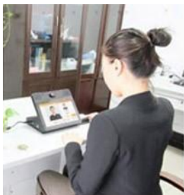
账户绑定人脸（注册）

智慧餐饮的概念新而宽泛。从技术与管理方式上考虑，主要涉及取餐、计量、支付的方式以及营养与健康管理等大数据分析技术；从应用场景上考虑大体可分为两类，一类是机关、企业、学校食堂，原则上不对外营业，服务对象单一并且相对固定；另一类是快餐、饭店、酒楼等商业化餐饮企业，面向大众，客流包罗万象并且流动性强。在机关、企业、学校食堂，支付技术方面，当前主流仍然是刷卡就餐，部分采用手机扫码代替刷卡，少数食堂开始采用人脸识别技术进行无感支付。从取餐方式上看，目前大多数仍然是食堂工作人员为就餐者盛饭盛菜，部分食堂采用由就餐者自由选取预先分好的小份饭菜的方式（“自选”方式又分为按碗杯颜色或在碗杯内植入芯片两种类型）。从现有媒体报道看，只有公司联合校联信息开发的“智慧餐饮”解决方案采用“自助”方式，就餐者完全按个人喜好、食量自己取菜盛饭，吃多少取多少。至于计量方式，“自选”方式仍然是按份计数，只有“自助”模式，每样备餐炉按克减量计重、计费，才能做到每种饭菜的数量完全由就餐者自由选择。至于营养与健康管理等大数据分析技术的运用，也只能基于“自助”模式。遍布城乡的快餐、饭店、酒楼等商业化餐饮企业，鉴于客源面广而又不固定，手机扫码逐渐取代现金、刷卡支付方式，部分快餐采用了“自选”取餐方式，尚未看到刷脸支付、“自助”取餐与营养成份分析的报道。公司智慧餐饮服务场景定位于机关、企业、学校食堂，在该领域，杭州雄伟科技的智盘系列产品为“自选”模式的代表，已经在众多高校、企业形成规模化应用。公司联合参股单位校联信息，运用公司成熟的AI技术，首创刷脸支付、精准计量、自助取餐、营养成分分析，兼具“自选”与“自助”模式，开始规模化推广应用，处于全行业领先地位。