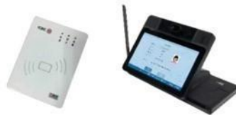
自主知识产权可信认证终端