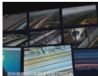
激光与热成像摄像机联动智能视频分析监控系统