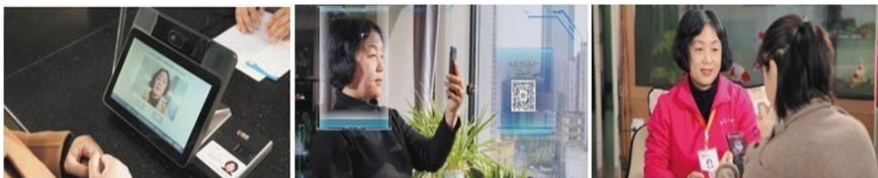
家政人员实名认证

济南家庭服务诚信管理方案采用标准化、规范化、流程化、智能化的社会诚信及职业诚信管理模式，也适用于家庭护士、网约车等其他各类新生中介服务业态。据有关报道，已有其他机构、企业上线类似的中介服务管理平台，但是公司主导的济南家庭服务诚信管理云平台在率先成熟应用互联网+可信身份认证方面具有一定的比较优势。