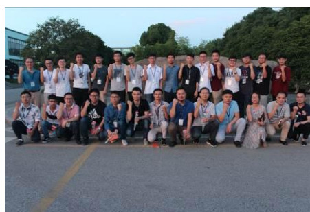
2018年应届毕业生入职培训暨毕业生欢迎会