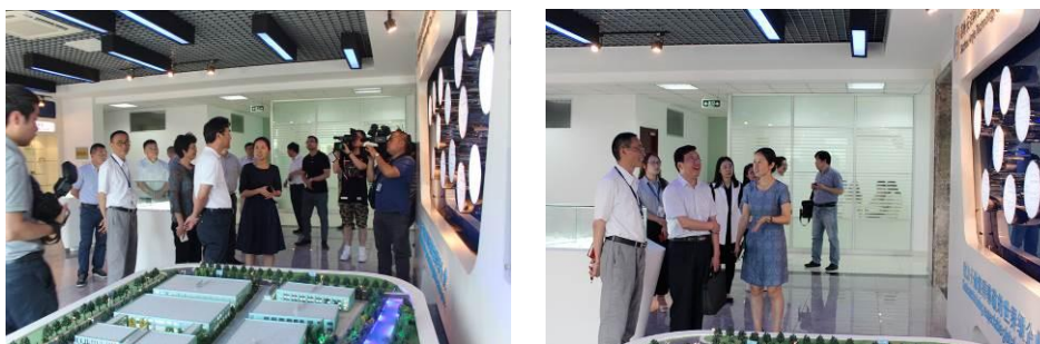
政府领导来访参观