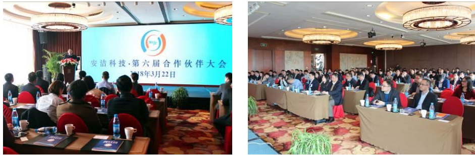
第六届供应商大会

2018年3月，安洁科技第六届供应商大会在苏州太湖高尔夫酒店召开。参加本次大会的供应商共有108家，156位供应商代表出席了本次大会。