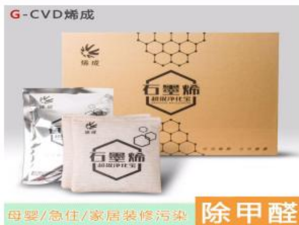
石墨烯空气净化宝