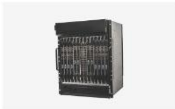
接入汇聚与集群软交换设备