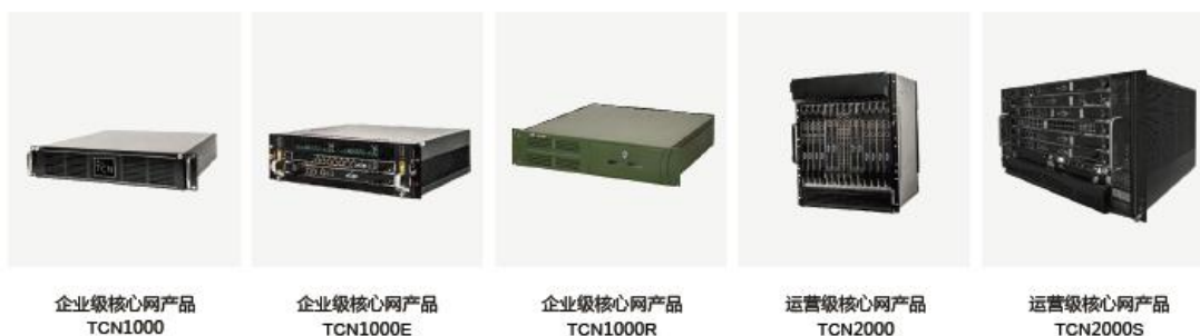
企业级核心网产品 TCN1000