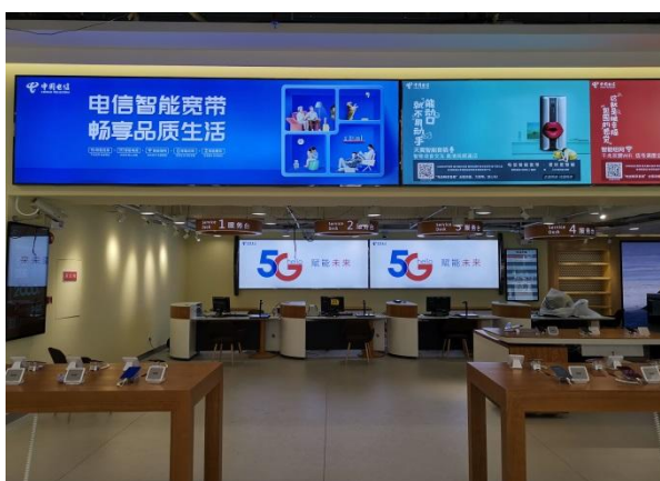
中国电信佛山市亲仁智慧营业厅项目