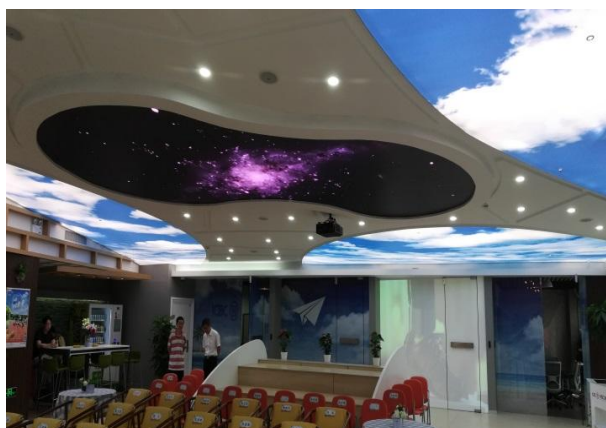
工商银行5G智慧网点南京大学未来广场支行项目