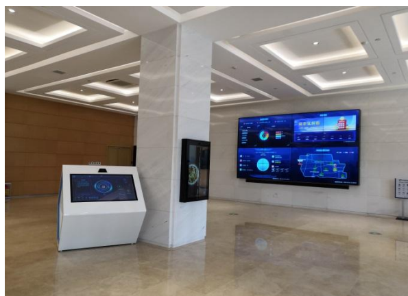
建设银行山东省济南市泉城支行智慧银行项目