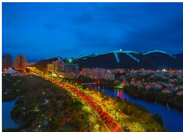
三亚市城市亮化提升项目