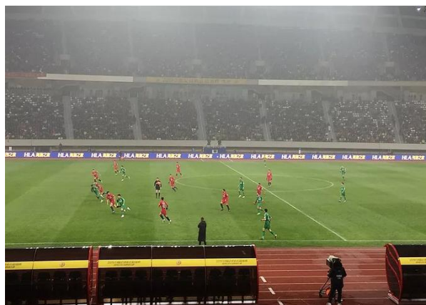
2019年中国足协超级杯项目