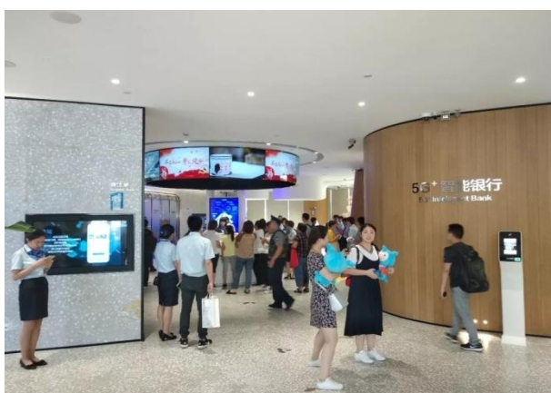
建设银行“5G+智能银行”北京市清华园支行项目