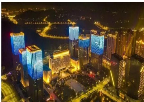
福建省平潭金井新城景观亮化项目

上半年，公司新研发的智能照明控制管理系统进一步完善升级，并广泛应用在各个景观亮化项目中，引领智慧照明行业智能化控制技术的发展，未来行业逐渐朝着智能化城市运营和视觉一体化的方向转变，公司的智慧照明整体解决方案将成为智慧城市建设中尤为重要的一环。