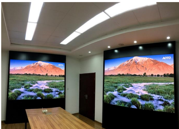
南京市公安局Mini LED0.9mm项目