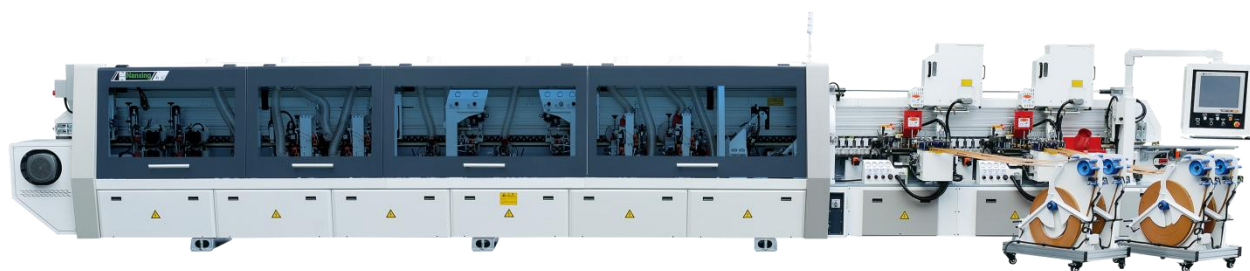
(4) 软成型自动封边机