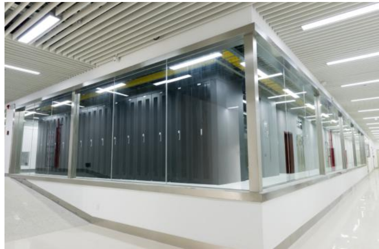
唯一·志享（华南）数据中心