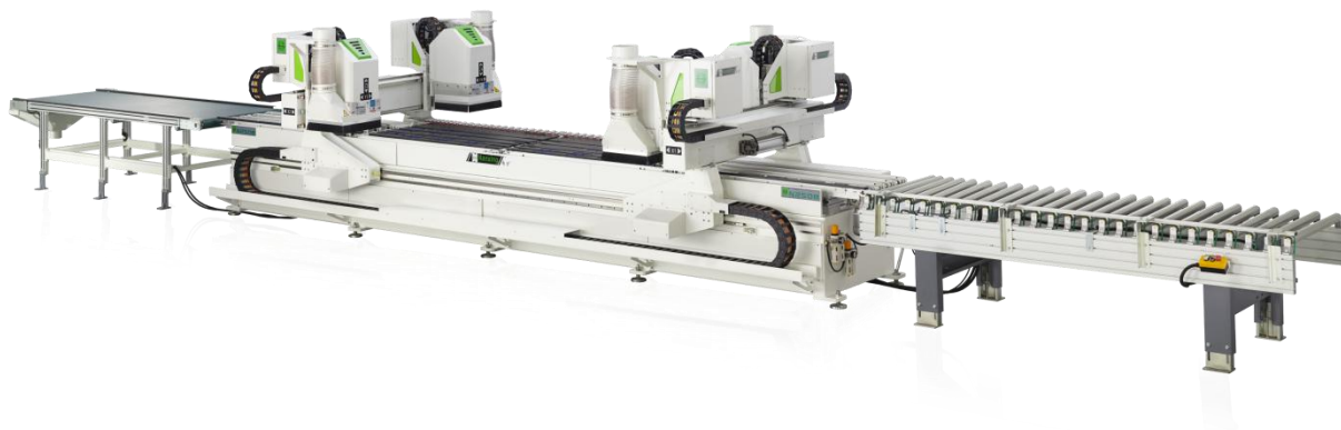
(6) 六面数控钻孔中心