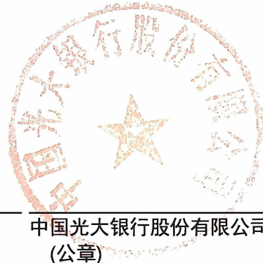
中国光大银行股份有限公司 (公章)