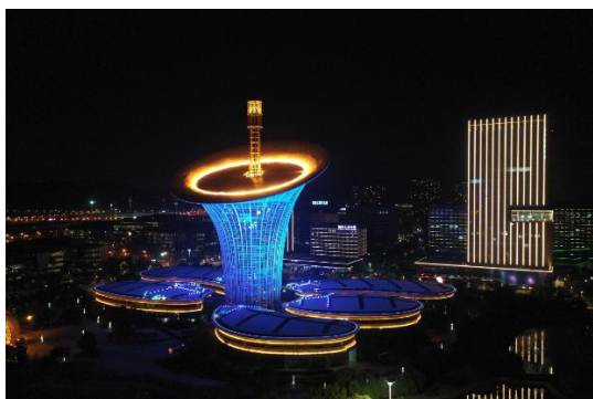
武汉军运会光谷亮化项目