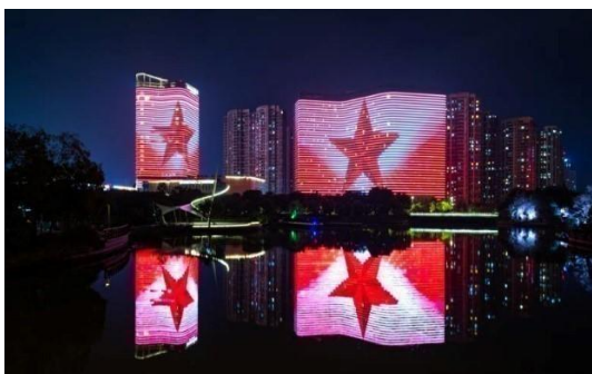
宁波北仑中心城区（黄山路、四明山路）夜景灯光提升工程