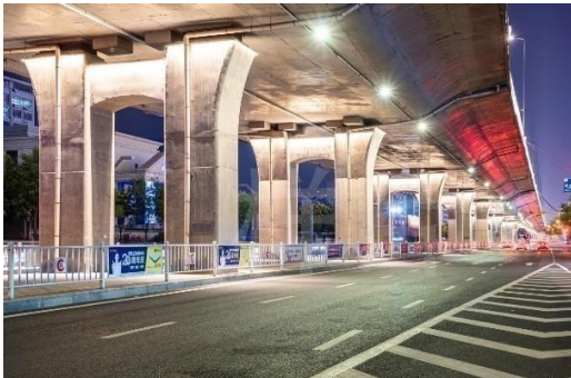
太原二青会城市景观照明亮化美化（二期）工程二标段