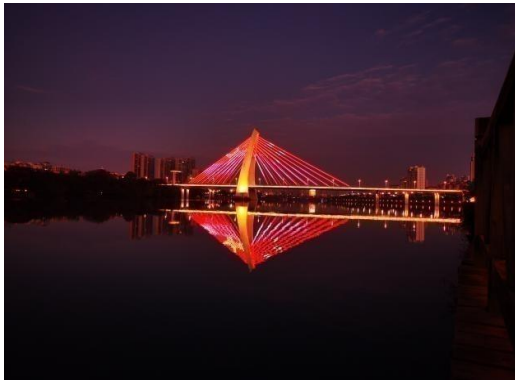
赣州市中心城区亮化工程总承包（EPC）项目