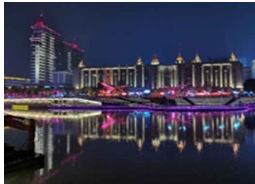
南通濠河风景区周边及通京大道道路两侧夜景亮化提升工程一标段