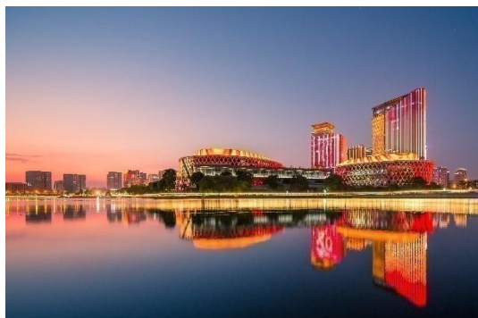
宁波镇海新城核心区亮灯工程