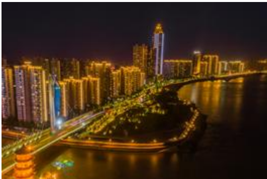
芜湖市弋江区城乡环境整治提升项目亮化工程建设项目