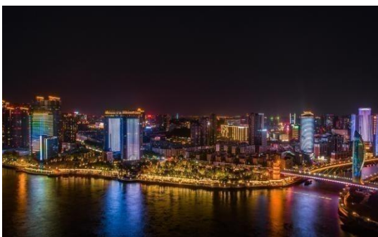
芜湖市十里江湾镜湖区段夜景亮化工程