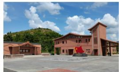
▲ 广东佛山·高明区杨和镇大布村乡村振兴示范村建设项目 (EPC)