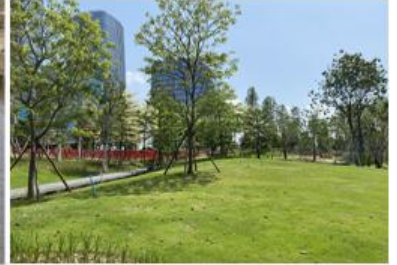
▲ 广东深圳·前海桂湾公园绿化景观工程施工总承包Ⅱ标