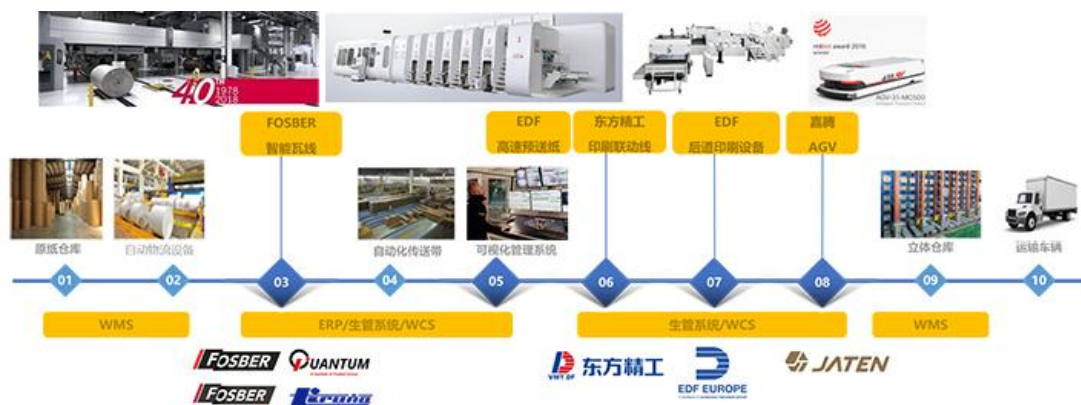
东方精工瓦楞纸箱印刷包装设备全产业链布局示意图

（2） 东方精工具备业内产品规格和市场定位最齐全、最丰富的产品库。例如在瓦楞纸箱印刷包装设备细分领域，东方精工可提供上、下印式多达数十种不同规格、不同市场定位的产品，远超竞争对手，可满足国内外行业市场客户多样化的设备需求。