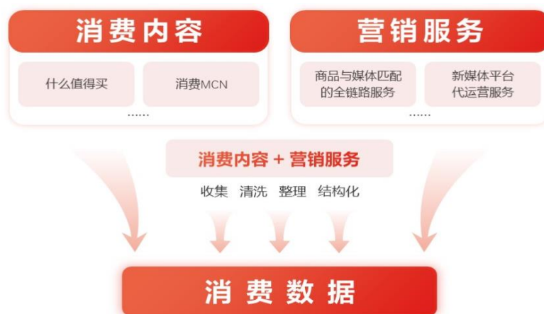
表: 消费数据业务模式

未来,公司将逐步沉淀来自于消费内容业务板块和营销服务业务板块的更多数据资源,形成更加丰富的涵盖人、货、场、媒等多种维度的底层数据体系,这些数据将在提升“什么值得买”平台结构化展示商品信息的能力和提升搜索与推荐内容分发的效率,以及在对外输出消费数据产品与服务等方面发挥重要作用。