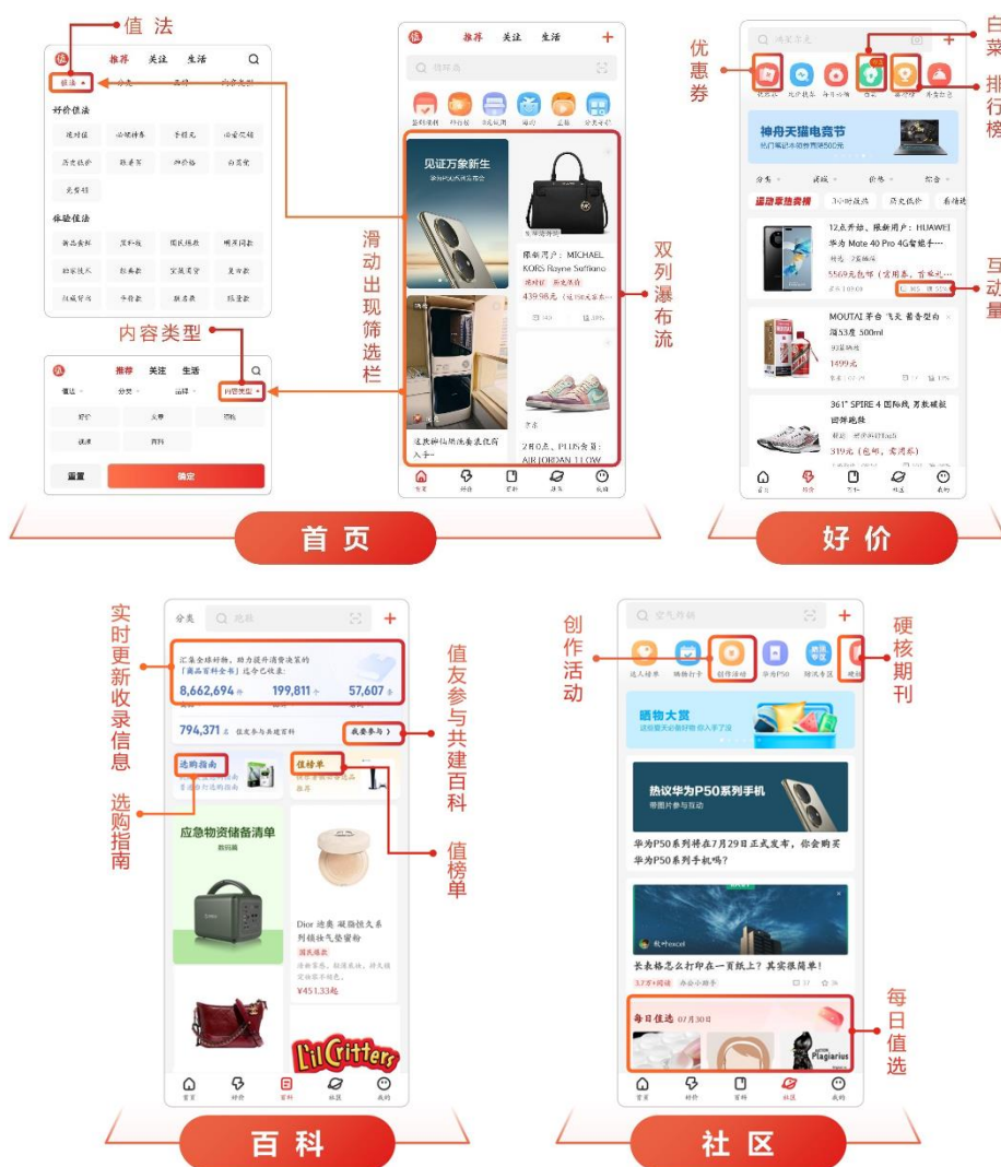
表：“什么值得买”App 10.0版本

为实现“内容更多元”及“推荐更精准”两大目标，帮助各圈层的消费者都能买到自己“值得买”的商品，“什么值得买”App进行了10.0全新改版，并于2021年3月25日正式上线。本次改版以“分享每一种值”作为全新的Slogan，并基于消费百科作为底层支撑，对首页、好价、百科、社区频道均进行全面升级，其中最主要的变化为：①首页升级为双列瀑布流样式，通过双列瀑布流的形式能够为用户呈现更多元的消费内容，便于用户进行浏览与选择，同时用户在传统的好价和长图文信息之外，还可以看到百科、晒物以及视频等多元内容；②突出百科频道，通过结构化地整理商品信息、价格指南、值友口碑、品牌故事、大事记等信息，为用户打造Wiki式的消费内容社区，为其提供更高效的消费决策；③升级晒物频道，作为社区频道中的重要二级子频道之一，升级后的晒物为用户提供了更轻短的内容发布和浏览功能，降低了用户内容创作与分享的门槛；④上线“值法”标签，本次改版上线了多种多样的“值法”标签，既包括绝对值、神价格、白菜党等好价“值法”，也包括新品尝鲜、黑科技、行业标杆、国民爆款、明星同款等体验“值法”，用户可以通过首页中的“值法”筛选器选择自己喜欢的“值法”标签，也可以通过被定义的“值法”标签判断内容的核心，从而更快速地获取到更精准的内容。