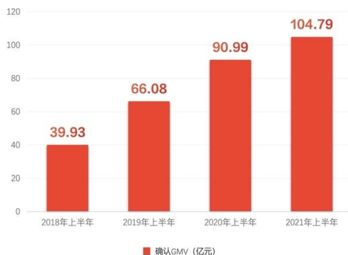
表：“什么值得买” 2018年-2021年上半年确认GMV（亿元）

“什么值得买”在助力品牌实现品效合一的营销效果方面持续获得客户与行业的认可，2021上半年公司凭借为小米有品、西门子、海尔等客户提供的优质服务，获得了“金鼠标年度数字营销影响力互联网媒体/平台”、“第12届虎啸奖消费内容类优秀奖”、“第七届金梧奖-移动广告创意节视频营销类银奖”、“2021IAI广告节效果营销类铜奖”等业内有影响力大奖。