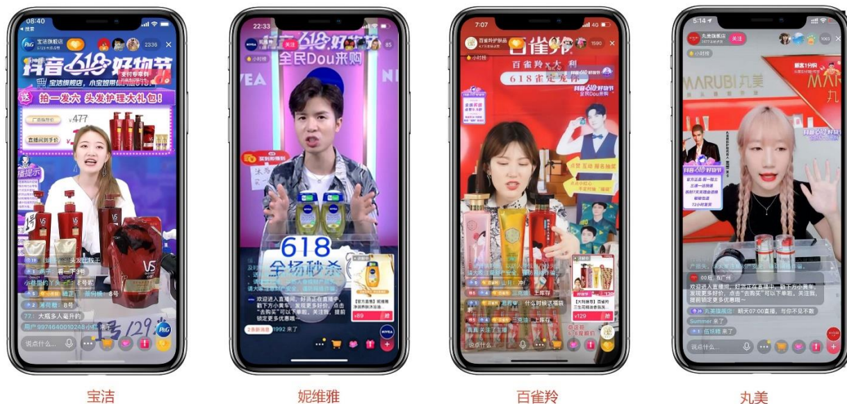
表：星罗部分服务案例

在服务品牌客户的过程中，星罗的服务能力得到持续提升。目前已经升级为具备小店代运营、蓝V账号短视频代运营、品牌自播直播间代运营、千川信息流投放、KOL/KOC带货营销服务等五大综合服务能力的服务商，同时星罗也是抖音官方认证的电商品牌服务商和千川核心代理商。