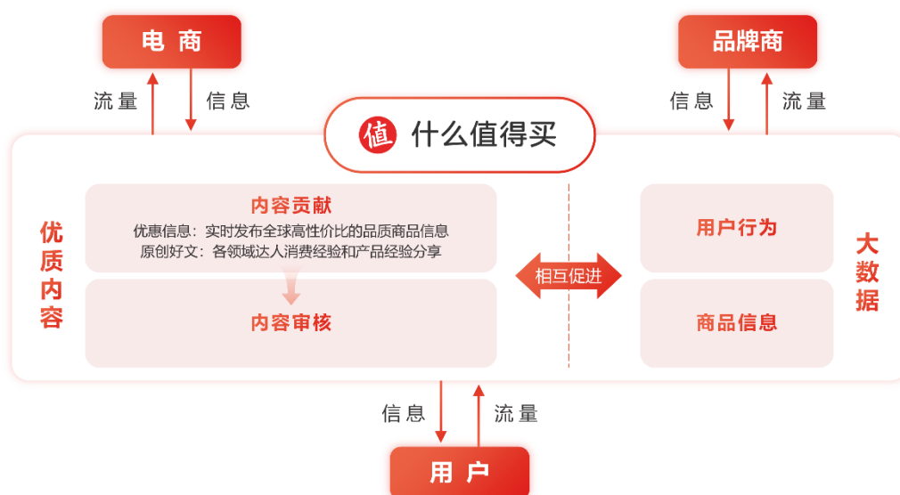
表：“什么值得买”消费内容生态

基于优质用户群体及消费内容生态，“什么值得买”为电商、品牌商等客户提供营销推广服务。根据收费方式的不同，分为电商导购佣金收入和广告展示收入两部分：其中电商导购佣金收入是指通过公司网站和移动应用展示电商、品牌商等客户的相关商品或服务信息，将用户引流至电商、品牌商官网，根据用户实际完成交易金额的一定比例向电商、品牌商等获取的收入；广告展示收入是指通过在公司网站和移动应用为电商、品牌商等客户提供广告展示等营销服务，向电商、品牌商等客户获取的收入。