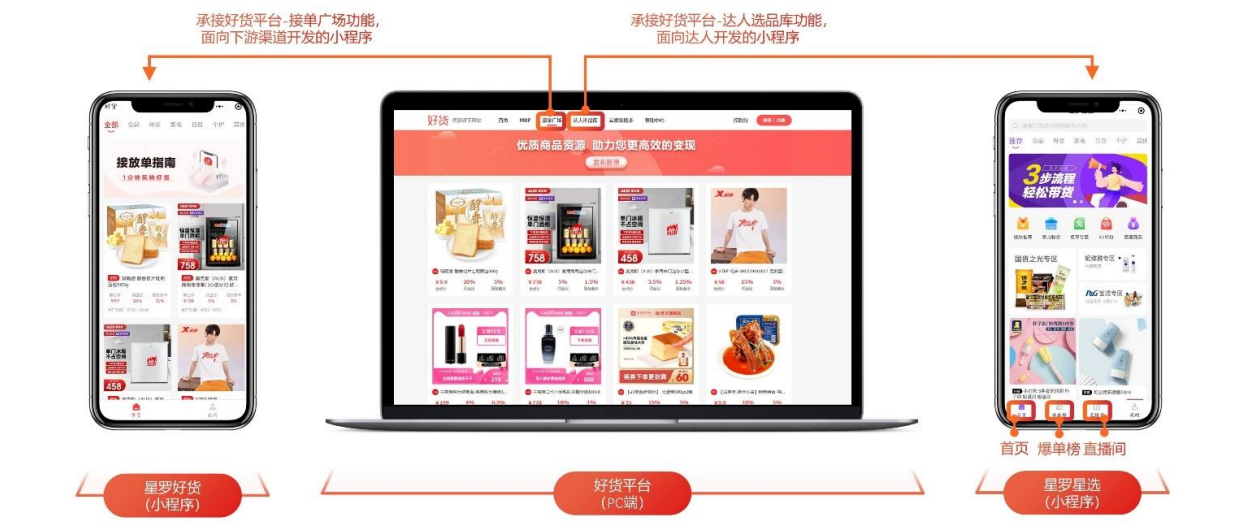
表:好货平台、星罗星选与星罗好货

在底层架构方面,星罗重点打造了以MRP(Media Resource Planning)系统和星罗罗盘为核心的两大支撑系统,对前端应用形成了良好的支撑。其中MRP是一个全链路多角色的协作平台,为商家和达人提供更加透明化的带货体验,通过提供专属直播日历、项目内容及执行日志、排期与样品执行监控、带货效果实时监控、平台动态提醒等功能,让带货全流程清晰可见、带货任务一目了然;星罗罗盘是一个全链路的数据监控和分析平台,拥有大量的达人数据积累,可以实时掌握平台和达人数据,基于数据形成更好的带货决策。随着星罗业务的快速发展及人货匹配次数的增长,星罗罗盘将拥有越来越鲜活的数据,可以帮助商家发展更适合商品调性的达人,也能帮助达人更高效地进行变现。