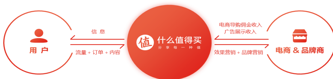
表：“什么值得买”盈利模式

基于优质用户群体及消费内容生态，“什么值得买”为电商、品牌商等客户提供营销推广服务。根据收费方式的不同，分为电商导购佣金收入和广告展示收入两部分：其中电商导购佣金收入是指通过公司网站和移动应用展示电商、品牌商等客户的相关商品或服务信息，将用户引流至电商、品牌商官网，根据用户实际完成交易金额的一定比例向电商、品牌商等获取的收入；广告展示收入是指通过在公司网站和移动应用为电商、品牌商等客户提供广告展示等营销服务，向电商、品牌商等客户获取的收入。