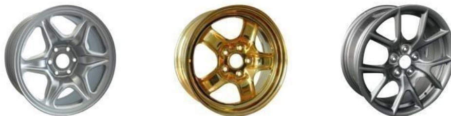
阿凡达乘用车车轮