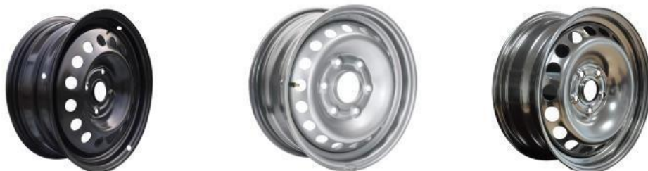
普通钢制乘用车车轮