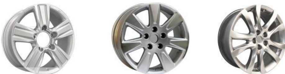
铝合金乘用车车轮