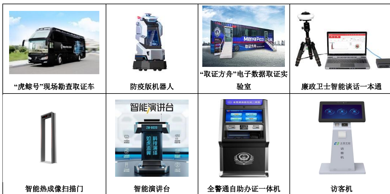
图12 智能装备部分产品图

(4) 智能装备制造 : 报告期内, 继“破冰计划”后, 公司落地了又一国产化战略行动, 成立福建美亚国云智能装备有限公司, 开展信创服务器研制, 美亚国云成立后迅速推出“宝石”系列信创服务器, 打造集基础硬件和云平台于一体的“IT数字底座”整体解决方案。控股子公司美亚中敏的智能装备创新中心和信创产品中心, 为客户提供专项及定制化设备, 为公司信创服务器产品构建研发生产能力; 根据常态化防疫需求, 美亚中敏推出智能热成像扫描门、智能热成像扫描仪、“小安+”防疫版机器人及防疫智能访客管理系统; 研制新一代智能演讲台, 结合人体工学与智能科技, 全面升级演讲体验。全资子公司珠海新德汇深化“放管服”相关政策, 为政务机关提供智慧便民相关产品。