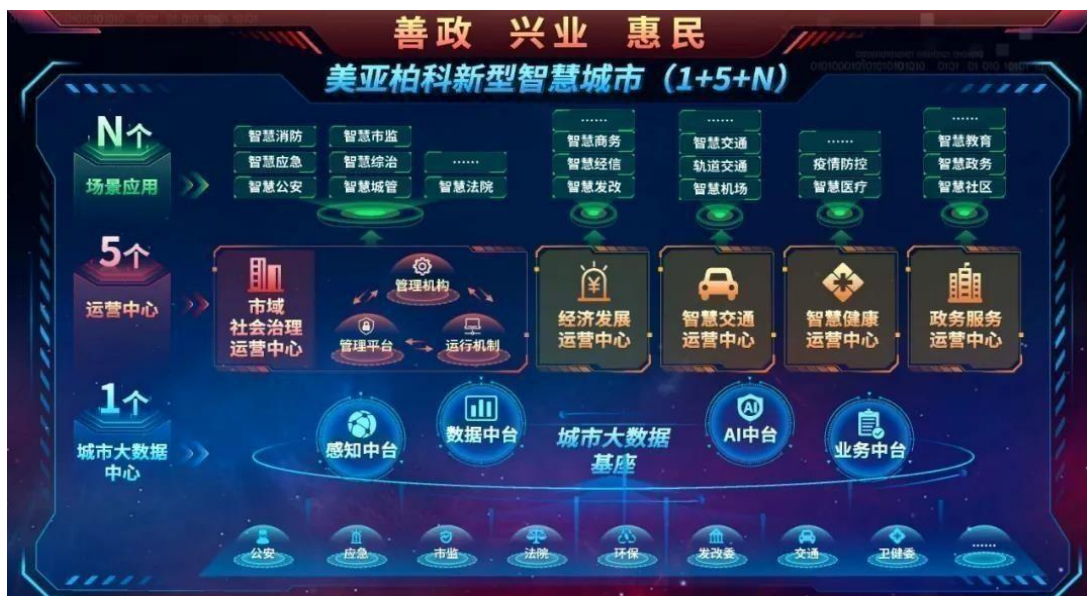
图10 美亚柏科新型智慧城市（1+5+N）架构

视频图像大数据： 基于自研的“乾坤”大数据操作系统（QKOS），融合“天算”建模平台、“天河”服务开放平台、“天匠”标签平台等“九天揽月”系列产品，美亚柏科研发的“慧视”视图中台产品创造性地把不同厂家的视图系统融为一体，将不同算法进行异构融合，遵照行业视频图像标准和大数据建设标准，最大化地挖掘视图的数据价值，使得视图数据、服务和AI能力全部池化、资源化、目录化，在安全、可控的前提下分级分类向外开放。2020年4月份，公司中标厦门市雪亮资源库项目，该项目研发的“慧视”视图中台是厦门全市的视图数据服务基础支撑底座，当前已为市应急管理局、自然规划局、消防救援支队、政法委等多家单位提供视图服务，有效赋能行业应用和市域社会治理。报告期内，公司成功中标某市视频图像中台项目，继厦门之后再添标杆项目。