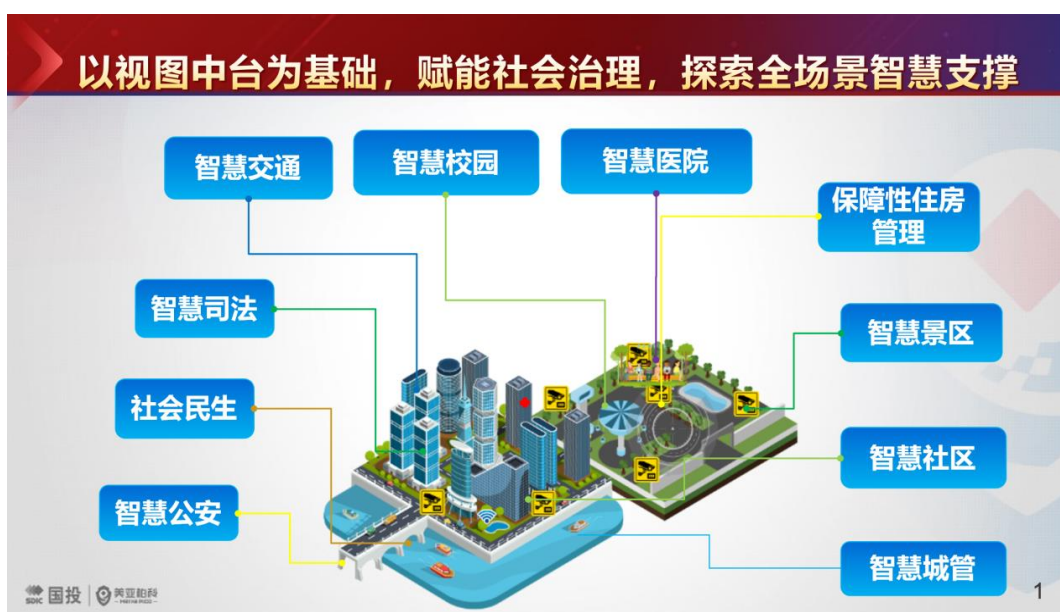
图11 美亚柏科“慧视”视图中台

视频图像大数据： 基于自研的“乾坤”大数据操作系统（QKOS），融合“天算”建模平台、“天河”服务开放平台、“天匠”标签平台等“九天揽月”系列产品，美亚柏科研发的“慧视”视图中台产品创造性地把不同厂家的视图系统融为一体，将不同算法进行异构融合，遵照行业视频图像标准和大数据建设标准，最大化地挖掘视图的数据价值，使得视图数据、服务和AI能力全部池化、资源化、目录化，在安全、可控的前提下分级分类向外开放。2020年4月份，公司中标厦门市雪亮资源库项目，该项目研发的“慧视”视图中台是厦门全市的视图数据服务基础支撑底座，当前已为市应急管理局、自然规划局、消防救援支队、政法委等多家单位提供视图服务，有效赋能行业应用和市域社会治理。报告期内，公司成功中标某市视频图像中台项目，继厦门之后再添标杆项目。