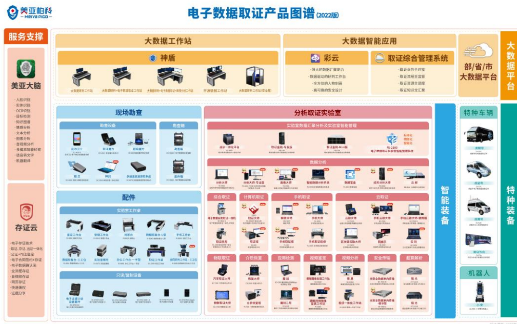
图7 美亚柏科电子数据取证产品图谱

网络安全大数据： 提出“长城计划”，以监管者视角，从网络安全大数据做起，拓展到政企网络安全。