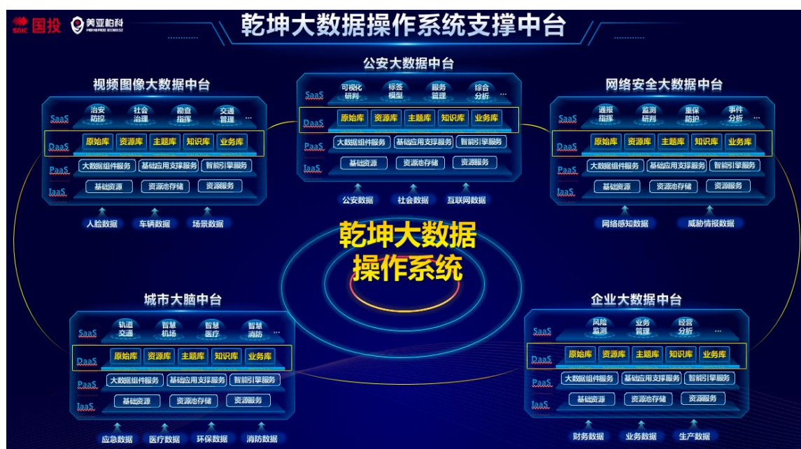
图9 美亚柏科“乾坤”大数据操作系统（QKOS）及支撑中台

公安大数据： 报告期内，公司参与了国家级大数据建设工程，缔造了公司大数据高质量发展的核心引擎，在输出大数据体系和数据安全体系、培养一批队伍、形成一批标准和规范的目标上迈出了一大步；持续推进公安大数据在省地市级的建设，加强“乾坤”大数据操作系统（QKOS）在各省地市的复制推广部署，在公安大数据平台能力基础上，强化大数据智能化应用建设，助力公安机关建设新一代“打击治理电信网络诈骗新型违法犯罪中心”，构建大数据分析预警模型，通过汇聚分析实现对电信网络诈骗精准预警、精准阻断。参与国家级大数据建设工程，缔造了公司大数据高质量发展的核心引擎，在输出大数据体系和数据安全体系、培养一批队伍、形成一批标准和规范的目标上迈出了一大步。