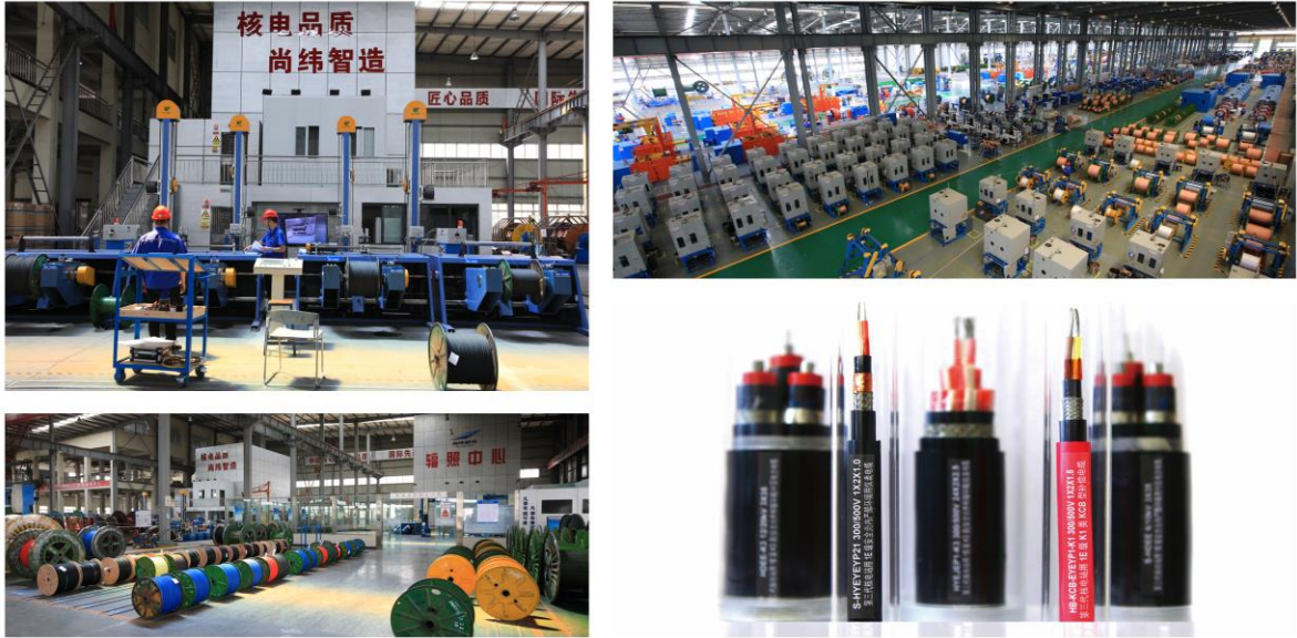
图 1: 公司生产车间、主要产品