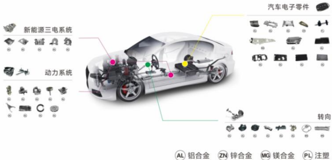
公司精密压铸产品在汽车的应用领域示意图

精密压铸业务主要从事铝合金、锌合金、镁合金精密压铸件、精密加工件的研发、生产、销售，并建立了模具加工及表面处理能力，打造一站式服务模式，提升产品配套及交付能力。目前拥有汽车关键零部件、精密3C电子部件及工业控制部件等产品线，公司专注“高精尖”领域，产品应用从动力系统、制动系统、转向系统等关键零部件延伸至新能源三电系统、热管理系统和汽车电子零部件（HUD、激光雷达、毫米波雷达）等，为客户提供有竞争力的、安心的产品与服务。