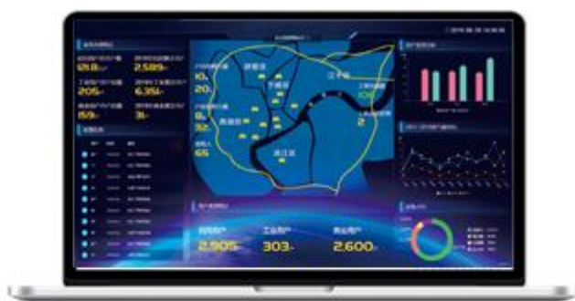
燃气云客户管理系统