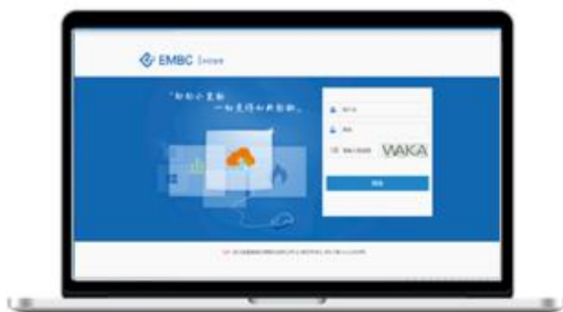
燃气云客户管理系统