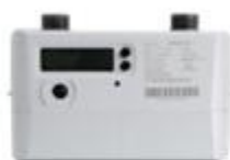
民用超声波燃气表

偿的全电子式仪表。公司充分运用超声波计量技术精度高、易于实现智能化等特点，向运营商提供全电子一体化的先进计量解决方案，满足运营商对计量终端设备长期保持计量准确度的要求，凭借实时温度补偿、耐低温、宽量程等技术优势，改善运营商供销差问题，全面解决日常计量、用气安全监测、漏损监测等需要。