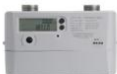
商业超声波燃气表