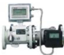
工业智能燃气流量计（控制器）