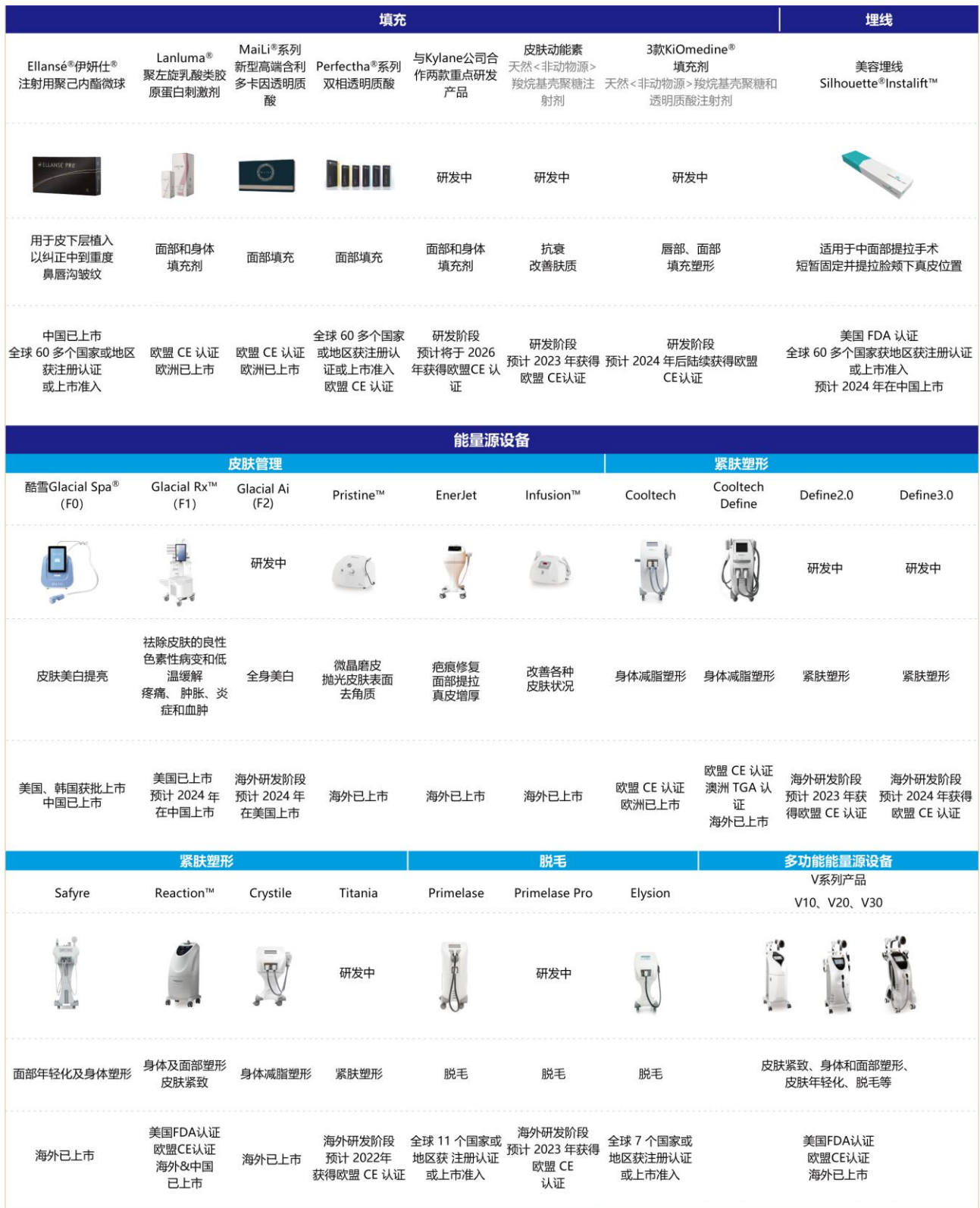
图：公司主要已上市及研发阶段医美产品