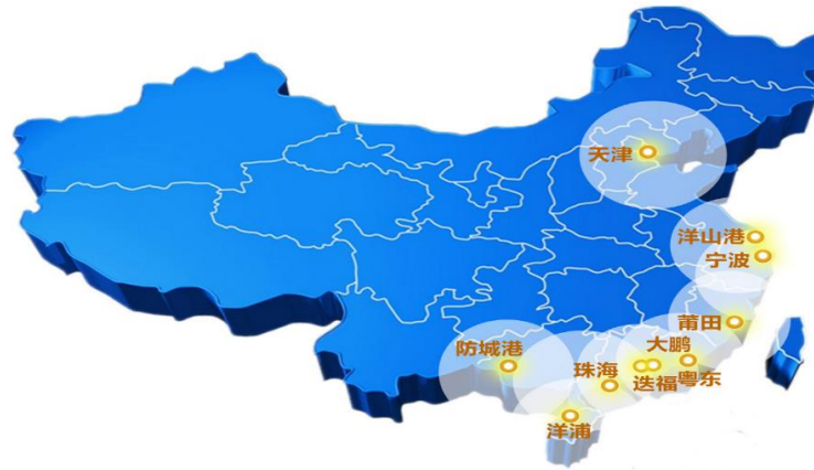
中海油LNG接收站布局

万吨，占国内 LNG 进口量的比例保持 40%左右。截至 2021 年底，中海油气电已投资建设 10 座 LNG 接收站，占全国 LNG 接收站数量的比例为 45.45%，接收能力 4,520 万吨/年，接收能力占比为 43.64%。在国内 LNG 供给格局中，中海油气电在进口量、接收站数量、接收能力等方面均占据主导地位。同时，中海油气电接收站分布相对合理，尤其华东、华南沿海区域，接收站数量更多，辐射区域更广。