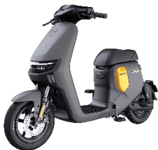
远行者 F 系列

远航家 M 系列于 2023 年 2 月 6 日正式开售。产品搭载 RideyLONG 长续航优化方案，通过轮胎科技、高性能无刷电机与电控调优的协调配合，在三档 55km/h 全速状态行使下，续航里程可达 107KM。同时维持 BMS6.0 智能电池管理、RideyGo! 即停即走系统等智能配置。