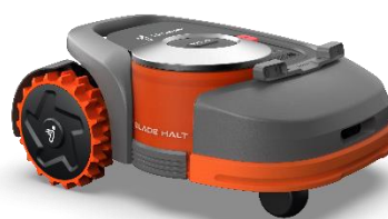
赛格威智能割草机器人 Navimow