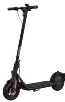
电动滑板车 F 系列