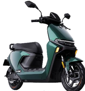
远航家 M 系列