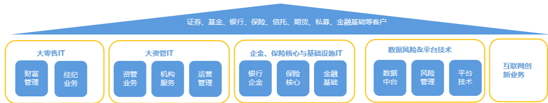
主营业务分业务线情况

根据产品或服务的类型，公司将经营活动划分为如下几类业务板块：大零售 IT 业务、大资管 IT 业务、企金&保险核心与基础设施 IT 业务、数据风险与平台技术 IT 业务、互联网创新业务和非金融业务共六大类。