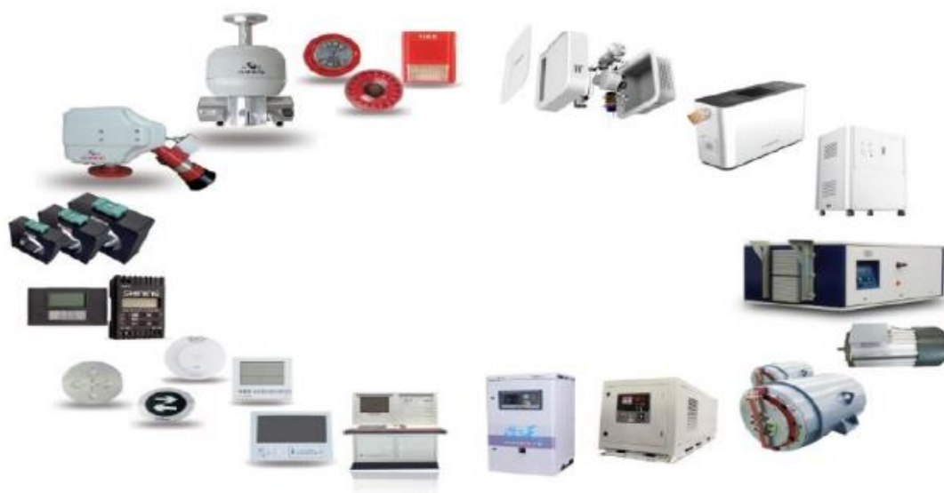
电力电子装备示意图

电力电子装备依托于全资子公司山鹰报警，主要产品有火灾报警系统、智能应急照明和疏散指示系统、监控探测系统、自动跟踪定位射流灭火系统、智慧消防软件平台等 16 个系列 411 种型号,并提供典型行业应用解决方案。