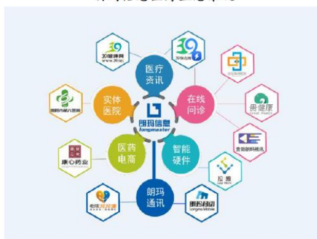
朗玛信息医疗生态系统

报告期内，公司围绕年初制定的经营目标，继续深耕“互联网+医疗”，推进线上互联网医疗服务+线下实体医院的医疗服务，电信及增值电信业务以创新业务发展、遵守行业监管为导向，各业务相互协作与协同发展，保持稳步增长，加速完善朗玛互联网医疗生态系统，提高综合竞争力。