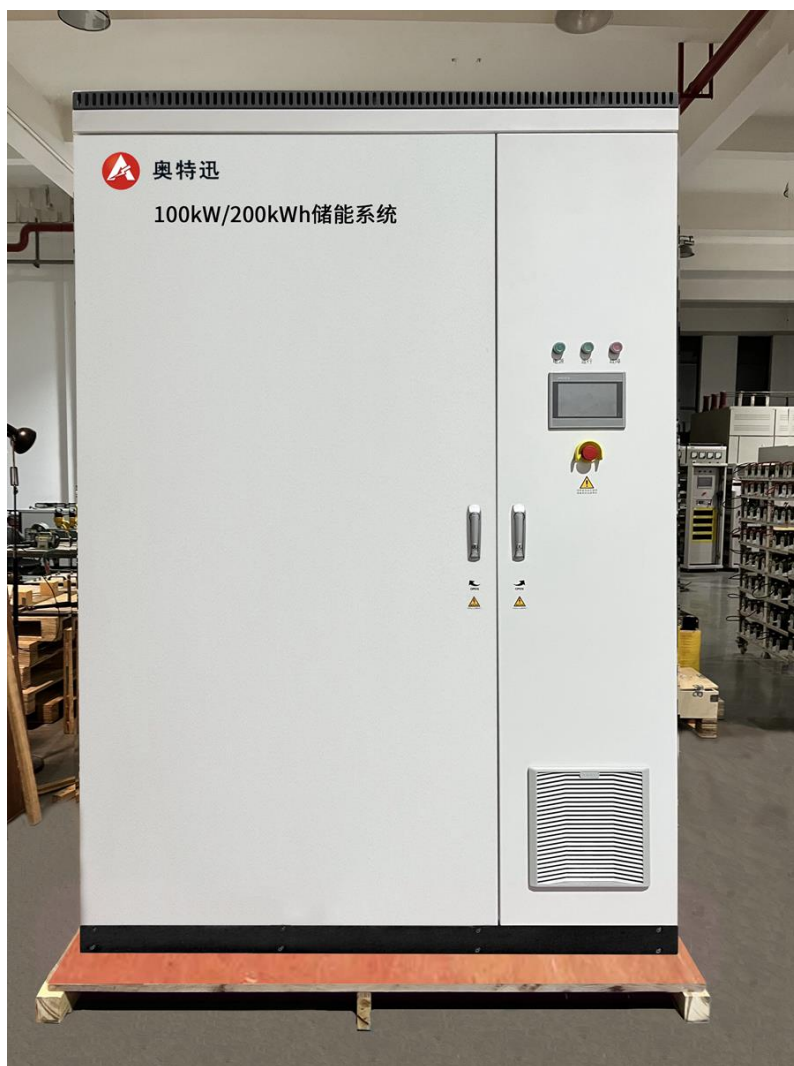
备注：图为 100kW/200kWh 分布式储能系统