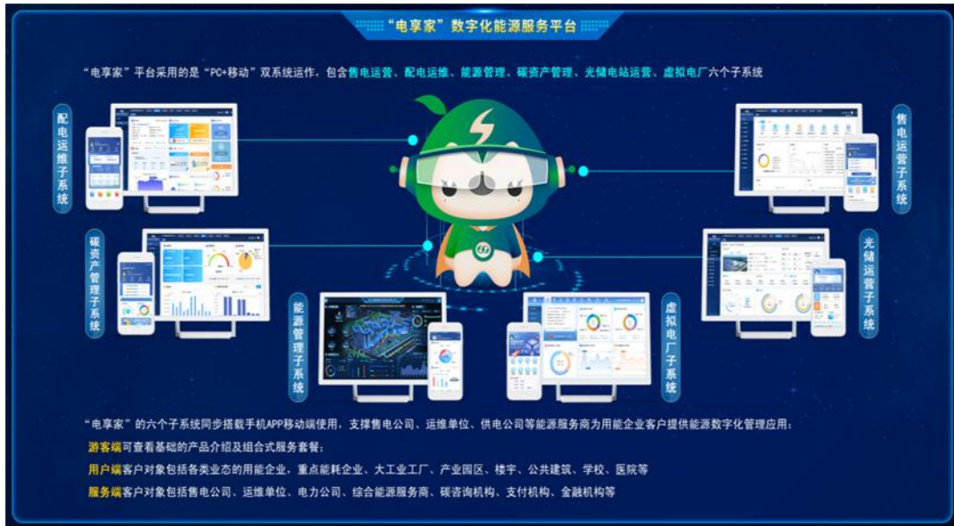
图 2 “电享家” 数字化能源服务平台

研发部署，完成“电-碳”市场发展推演及省间电力交易关键问题研究管理咨询项目，逐步夯实包括碳减排、碳监测、碳咨询以及碳资产管理平台在内的双碳业务体系。