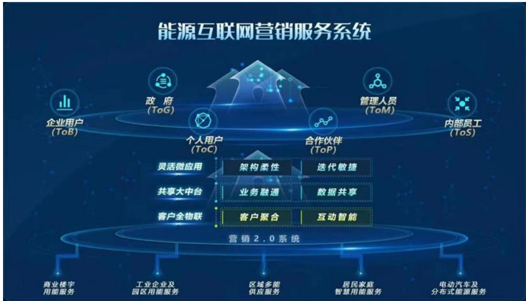
图 1 能源互联网营销服务系统示意图

报告期内，完成 营销 2.0 统一软件研发，攻克了大型复杂应用软件基础设施云化、业务中台化、应用场景化动态编排等系列技术难题，完成浙江、安徽等地营销 2.0 建设实施。支撑 网上国网 建设，建成公用事业领域最大的线上服务平台，成为能源行业应用排名第一、国资央企旗下名列前茅的 APP 产品，沉淀了“刷脸办”“一证办”等便民服务及多款特色微服务，搭建首家与国家政务服务平台贯通的国有企业服务专区，实现网上国网由项目建设向产品运营转型。打造 企业级工单中心 产品，可实现工单状态、提醒、预警、评价等全流程闭环管控，为用户构建便捷化工单获取窗口，已在重庆成功打造示范样板并在电网市场内推广，获评数字化专项示范优秀成果。开展 智慧变电站 场景应用的市场拓展，承建国网江苏省公司等多座变电站远程智能巡视建设。参与 新型电力负荷管理系统 研发攻坚，参与规划设计及平台建设，承建了国网总部和天津、冀北、辽宁等 7 个省公司的系统建设任务，其中自主研发的统一汇集组件在国网总部及 27 个省公司实现落地应用，实现电网生产运行领域新突破。同时，公司承接新型电力系统负荷精准调控科技项目课题，该项目入选国网十大重点科技项目之一。推进 电力市场化交易 业务规模化发展，依托自主研发的“电享家”数字化能源平台，已为 2500 余家客户提供电力交易服务，交易电量超 69 亿千瓦时。参与 虚拟电厂 相关示范工程建设，打造覆盖“源网荷储充”一体化运行虚拟电厂运营平台，平台已接入华北辅助服务市场、天津虚拟电厂、上海虚拟电厂参与电网调节，实现面向企业园区、商业楼宇用户的区域能源资源的优化配置。