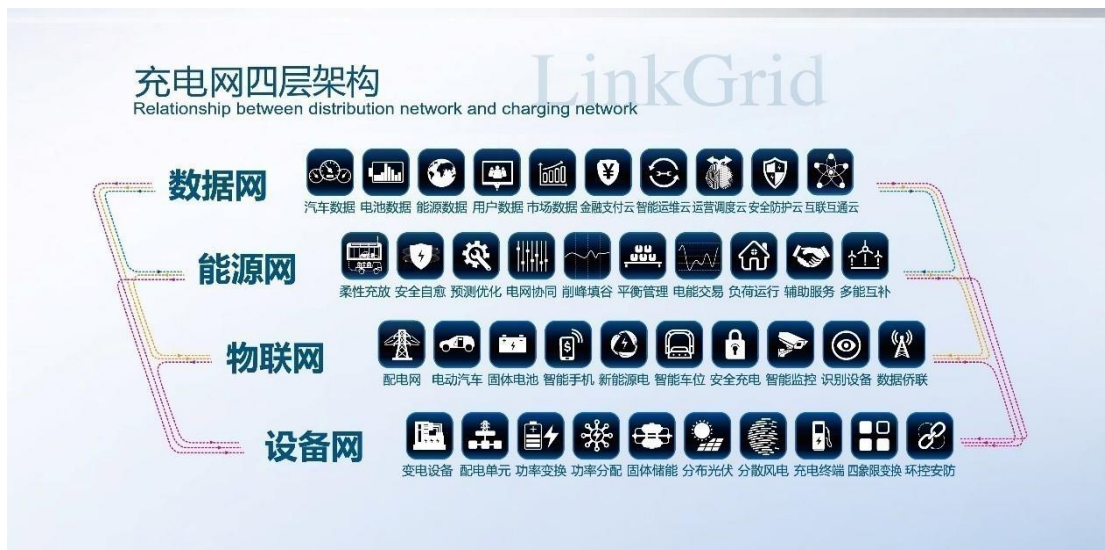
图 1：四层网络架构的云平台技术体系

调度，通过数据信息与调度控制打通设备网、物联网、能源网以及数据网，在提高充电安全的同时，实现充电设备、汽车、用户、能源的高效协同。