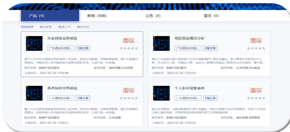
(截图来源：贵阳大数据交易所 https://www.gzdex.com.cn/search )