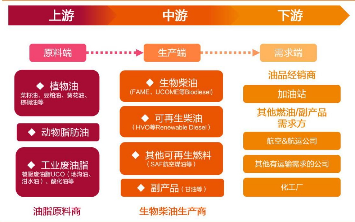
生物柴油产业链示意图

公司控股子公司天汇健主营业务为废弃物资源综合利用，利用回收的废弃油脂生产、销售工业级混合油（UCO），产品主要用于生产烃基生物柴油（HVO）。目前，天汇健第一代工业级混合油年产能可达 1 万吨，第二代工业级混合油年产能可达 5 万吨，形成了以第二代工业级混合油为主，第一代工业级混合油为辅的产品结构。天汇健处于所在产业链的上游原料端的工业废油脂的生产制造，其所在产业链如下图：