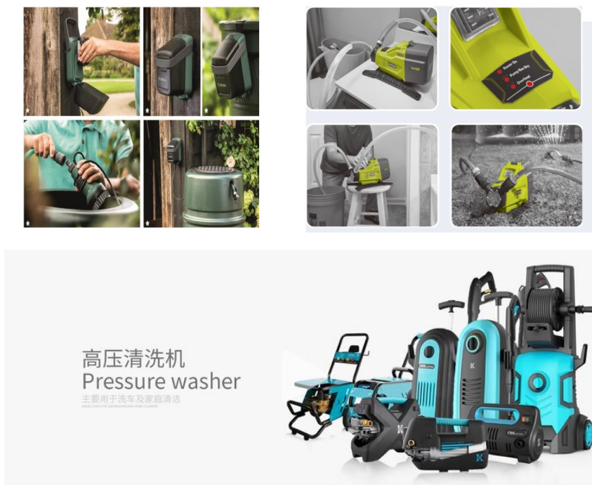
图 2 产品应用场景展示

报告期内，公司专注于家用水泵、商用水泵和清洗设备等产品的研发、生产和销售，主营业务未发生变化。