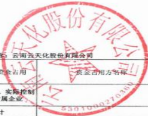
2023年度非经营性资金占用及其他关联资金往来情况汇总表