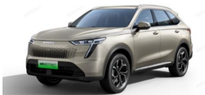
哈弗 枭龙 MAX

枭龙 MAX 定位全能电四驱新能源 SUV，首次搭载全球首创智控电混技术 Hi4，新车型以强大的四驱动力和全能的科技享受，通过四驱动力+两驱价格加速科技平权落地，重定城市家用新能源 SUV 购车新标准。