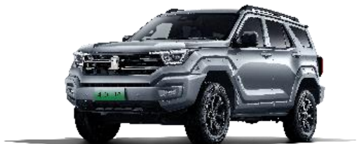
坦克 400 Hi4-T

坦克 500 Hi4-T，是坦克品牌依托越野超级混动架构 Hi4-T，落地量产的新能源越野 SUV 第一车。定位“中大型豪华越野新能源 SUV”，坦克 500 Hi4-T 全面满足了用户对于城市通勤、近郊出行、长途旅行、穿越露营、拖挂房车的多样化用车需求，拓宽人车生活边界，带来强动力、多场景、极度可靠的标杆级的用车体验。坦克 500 Hi4-T 与 2023 款坦克 500 一起，为消费者市场提供完整的中大型豪华越野 SUV 解决方案。