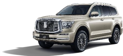
坦克 500 Hi4-T

坦克 700Hi4-T 以全球金字塔顶端越野技术，铸造中国越野旗舰，以“独一无二”的卓越性能，建立豪华越野新标杆，为越野爱好者和城市精英提供顶奢的驾乘体验。