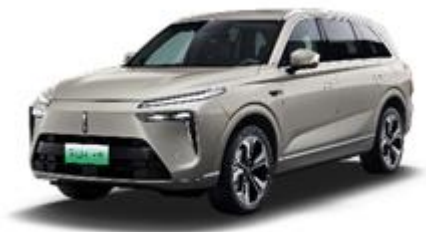
魏牌 蓝山 DHT-PHEV

魏牌高山 MPV 定位于“出行头等舱”，基于全球首个新能源高端 MPV 专属平台打造的 MPV 品类“独一无二”的一车双款。其中，高山行政加长版首搭领先不只一代的“Hi4 性能版”智能四驱电混技术，同时凭借全球最大空间尺寸以及顶奢豪华配置，打造 MPV 领域“独一无二”的全场景豪华舒适体验。高山 MPV 家族以超越百万的产品价值，重新定义新时代高端 MPV 新标准。