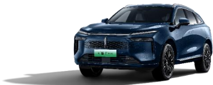
魏牌 新摩卡 DHT-PHEV

魏牌 蓝山 DHT-PHEV 是基于“咖啡智能平台”打造的高端新能源大型 SUV，定位为“大六座舒适电动 SUV”。蓝山以全新“简约、科技”的设计理念、高品质超大舒适空间以及全球领先的智能 DHT 技术等核心产品优势，力求满足家庭多场景用车需求。