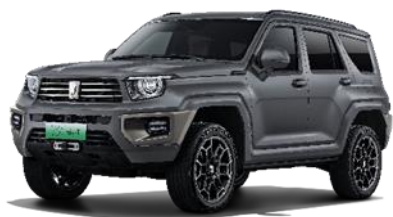
坦克 700 Hi4-T

坦克 700Hi4-T 以全球金字塔顶端越野技术，铸造中国越野旗舰，以“独一无二”的卓越性能，建立豪华越野新标杆，为越野爱好者和城市精英提供顶奢的驾乘体验。