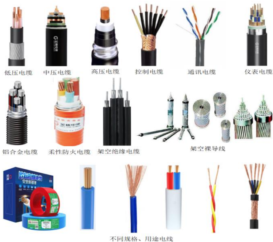
图：公司主要线缆产品