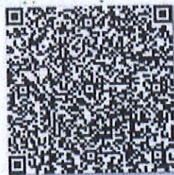
真实的年检二维码

本证书经检验合格，继续有效一年。 This certificate is valid for another year after