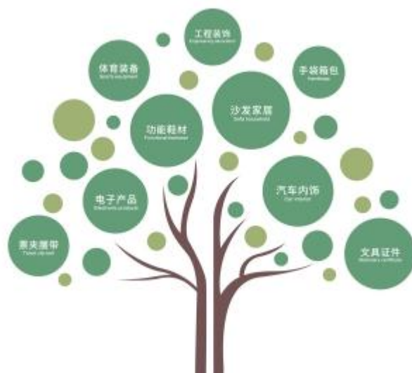
图 3：公司产品应用领域