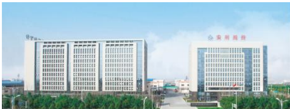
图 2：公司规模实力领先，行业地位突出