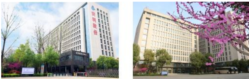
图 4：安利股份绿色厂区

公司是全国同行业唯一同时通过国际 Oeko-Tex Standard 100 信心纺织品、国际绿叶标志、GRS 全球回收标准、国际 Higg FEM 环境模块、ISO14001 环境管理体系、ISO14024 中国环境标志产品、ISO50001 能源管理体系认证的企业。