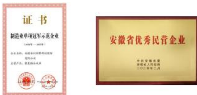
图 1：公司是国家工信部认定的“全国制造业单项冠军示范企业”，2024 年被安徽省委、省政府表彰为“安徽省优秀民营企业”

公司是“国家重点高新技术企业”“国家认定企业技术中心”，是 2024 年 1 月国家工信部认定的“国家技术创新示范企业”，是“国家知识产权示范企业”和“国家工业企业知识产权运用试点企业”，获“中国专利优秀奖”，拥有“国家级博士后科研工作站”，是“中国轻工业科技百强企业”和“全国民营企业发明专利 500 强企业”。