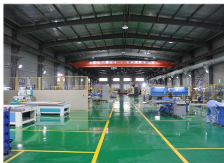
复合材料生产车间