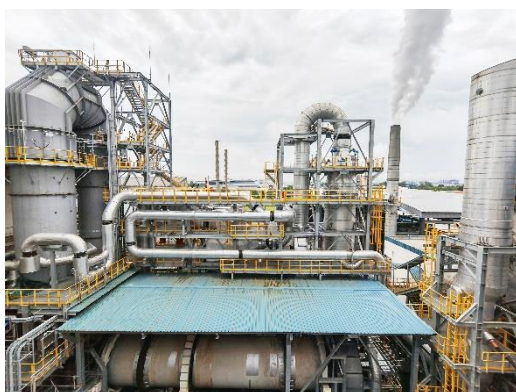
ECO 新加坡炭黑焚烧项目

公司环境科技业务实现营业收入 5.34 亿元，较上年同期减少 18.56%。主要在施项目包括湛江巴斯夫处理项目、山东裕龙岛炼化项目、海南洋浦港危险废物处理中心项目、广西华谊废液焚烧项目、吉林美思德项目、新加坡 ECO 焚烧项目等。