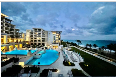
巴巴多斯山姆罗德酒店项目