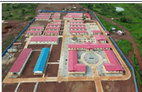
科特迪瓦旱港建设项目营地