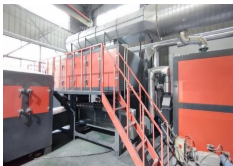
复合材料环保设备

公司复合材料业务实现营业收入 1.18 亿元，较上年同期增长 33.34%，主要原因是工厂产能进一步扩大。报告期内，亚德材料荣获浙江省创新型中小企业认定，获得浙江省湖州市市级科技企业研究开发中心认定。