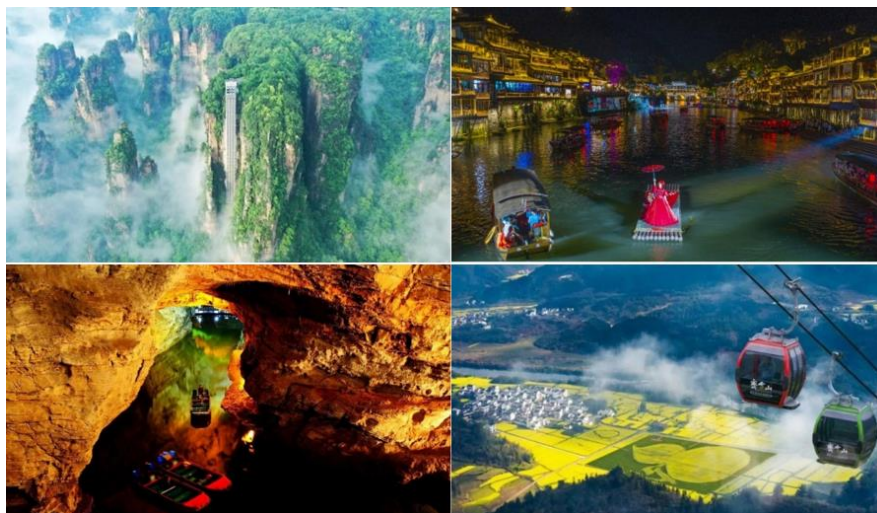
（左上：张家界百龙天梯；左下：黄龙洞游船及语音讲解服务； 右上：湖南凤凰古城沱江游船；右下：齐云山景区月华索道）

公司在齐云山景区提供月华索道、横江山水竹筏漂流和景区交通车等旅游运输服务，为游客提供多样化交通服务，丰富游客休闲游憩选择，极大地改善了当地旅游交通环境。