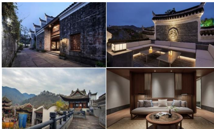
（熊公馆、万寿宫客栈酒店）

凤凰古城熊公馆的前身是熊希龄的故居，位于凤凰古城景区内核心位置。项目在保留了建筑原貌和文化底蕴的同时，最大程度提升了品质，是一家集高端住宿、特色餐饮、休闲旅游以及多项增值服务于一体的高端精品客栈。凤凰万寿宫客栈面朝沱江，集餐饮娱乐、休闲度假、会议商务于一体。