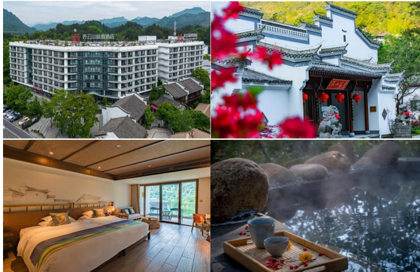
（左上、左下：齐云山祥富瑞酒店；右上、右下：黄山祥源云谷度假酒店）

碧峰峡景区酒店主要有萌趣东方动物主题酒店（111 余间）、望幽山居和逸养空间（共 11 栋 43 间），分别覆盖经济型和高端型消费人群；餐饮方面，可容纳 300 人同时用餐，提供中西式美食。此外，景区内还有会议室、多功能厅及 VIP 接待室、生态演艺美食广场、茶楼等，是多业态融合的综合型商业体。